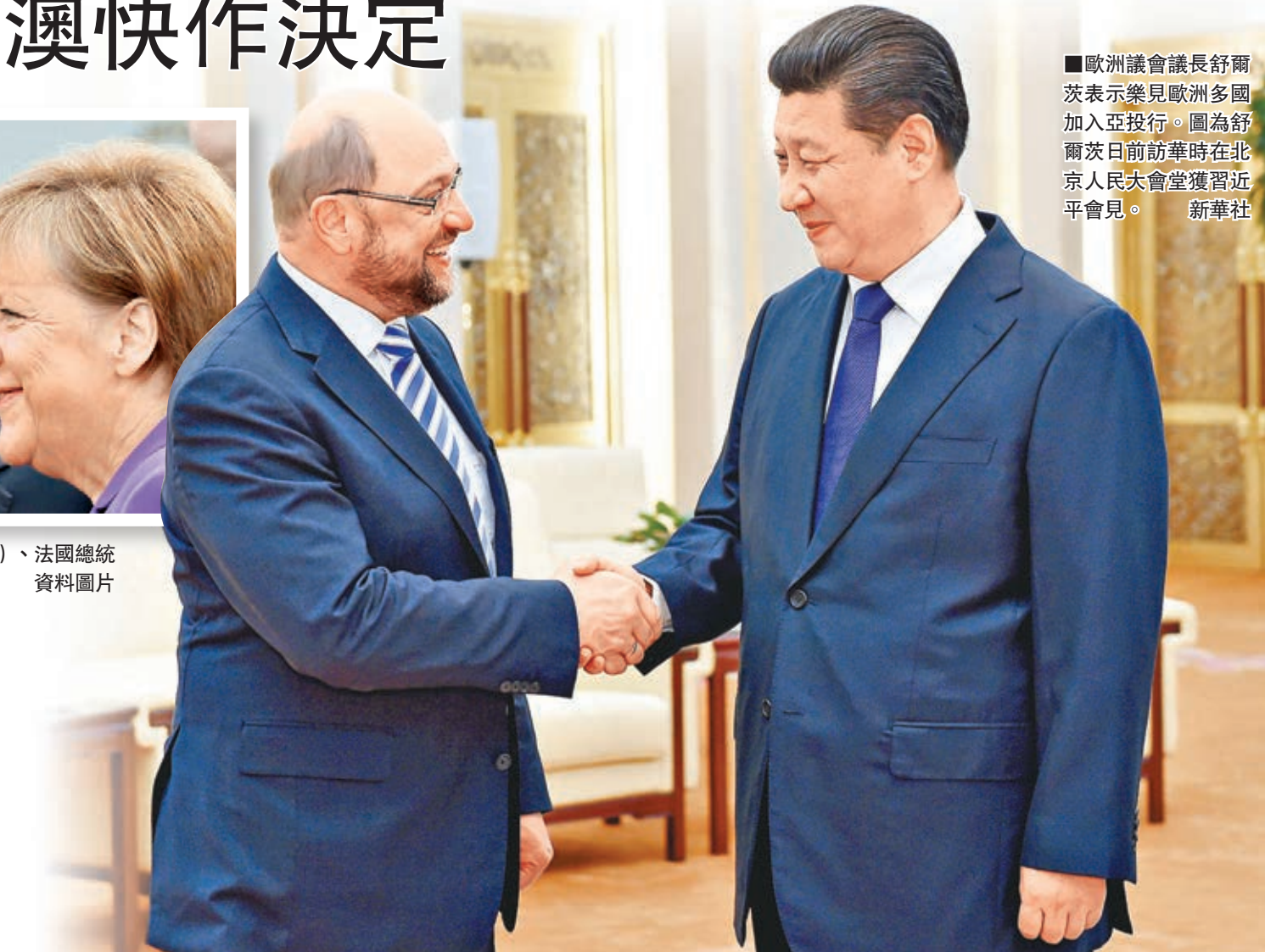
■歐洲議會議長舒爾茨表示樂見歐洲多國加入亞投行。圖為舒爾茨日前訪華時在北京人民大會堂獲習近平會見。