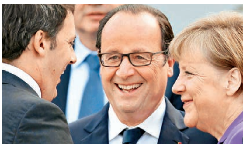
■德法意追隨英國加入亞投行。圖為德國總理默克爾（右）、法國總統奧朗德（中）和意大利總理倫齊（左）。

香港文匯報訊（記者海巖北京報道）隨着創始成員國申請截止日的臨近，亞洲基礎設施投資銀行（AIIB，簡稱亞投行）的「朋友圈」日益擴大。據外媒報道，法國、德國和意大利均已決定追隨英國，加入中國主導的亞投行，而韓國和澳洲也有意改變不加入亞投行的決定。