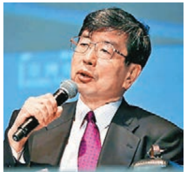
■中尾武彥表示，已開始討論與亞投行進行合作。

此外，亞洲開發銀行行長中尾武彥16日接受日本經濟新聞中文網採訪時表示，已開始討論與中國主導的亞投行進行合作。據中尾表示，在與開發有關的知識等實務級領域，回答了來自中方的諮詢。另一方面，中尾表示：「希望（亞投行）遵循國際標準」，在運營的透明性等方面對亞投行進行了牽制。