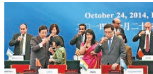
■中國籌建亞洲基礎設施投資銀行備忘錄簽字儀式去年10月在北京舉行。

應調整方向。「美國應加入亞投行，並說服國會提供取得亞投行少數股權所需的小筆資金。美國應鼓勵其亞洲和歐洲朋友加入亞投行，以便在中國採取任何不利行動時幫助美國一同加以反對。美國還應鼓勵世行和其它現有多邊貸款機構與亞投行密切合作。這樣，亞投行項目就能在世界經濟中扮演積極角色，並受益於中國不斷增強的發揮建設性全球領導力的意願。」