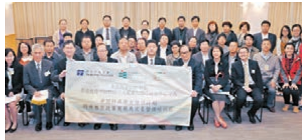
■「中國特殊教育培訓計劃」開幕禮。

香港文匯報訊（記者高鈺）田家炳基金會近日贊助香港教育學院舉辦「中國特殊教育培訓計劃」，活動昨舉行開幕禮，田家炳基金會主席田慶生及基金會委員、教師師生及一眾學員出席典禮。