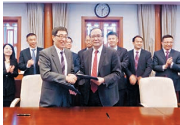
■郭位（前左）與林建華簽訂了學生交換計劃協議。

部分認為在香港升學機會較為渺茫的學生，亦希望北上升學一技之長。陳同學就表示，自己預計文憑試核心科目將獲11分至12分，本地升學會很困難。不過，現時其應用課程有選讀中醫，對這個科目亦有興趣，故希望可以到廣州中醫藥大學升學，修讀相關課程。她坦言，自己在內地沒有親戚，若要到當地升學亦會有點擔心，「但始終都是讀書、工作比較重要，所以也不介意。」