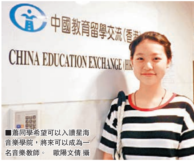
■蕭同學希望可以入讀星海音樂學院，將來可以成為一名音樂教師。

免試招生計劃雖然本周五才截止網上報名，但現場確認階段昨日已經開始，已報名的應屆考生均要預約時間到場辦理手續。計劃舉行了數年，港生對內地院校的認知和信心明顯有所提升。