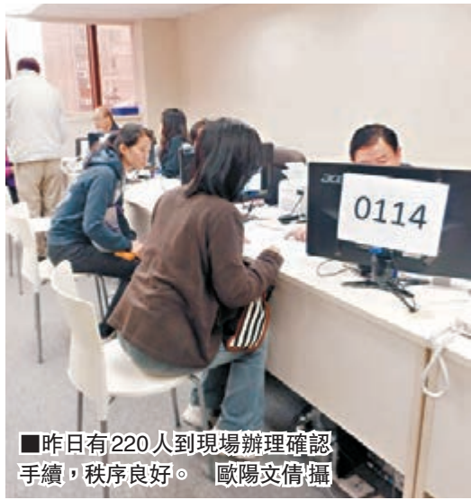
■昨日有220人到現場辦理確認手續，秩序良好。

香港文匯報訊（記者歐陽文倩）近年北上升學漸成趨勢，2015年「內地部分高等院校免試招收香港學生計劃」昨日開始現場確認階段，首日已有220位應屆文憑試考生相應到不同中心辦理手續。有心儀清華大學法律課程的尖子表示，內地頂尖名校的課程與本地院校相比毫不遜色，甚至有更多交流機會，是很好的讀書機會；也有希望發展音樂事業的學生，因為香港缺乏相關課程，一心瞄準星海音樂學院，希望可以在該校發展所長。