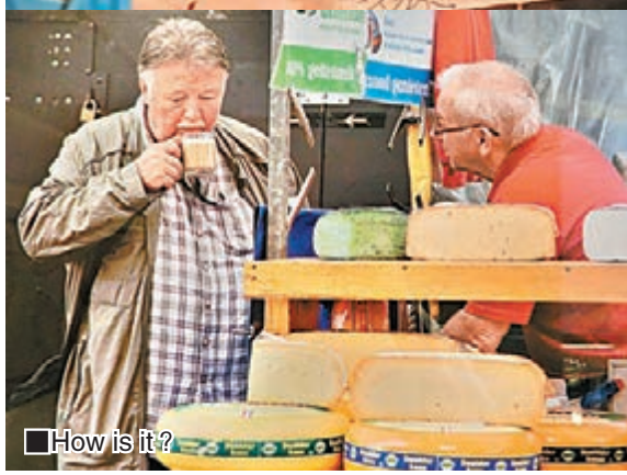
■How is it?

中，能夠找到這樣的心靈軌跡。拍攝自柏林的作品The potato man，讓市集的生活多了一絲幽靜。照片中的potato man，手中拿著一份報紙，心無旁騖地認真閱讀，而potato本身則似乎成為了畫面中的一個前置的背景。人在生活中面臨諸多挑戰，但是閱讀所代表的心靈淨化，則始終是生活中不能夠缺少的精神主題。因此，市集，在他者的眼中，代表的更多是消費和物質；但是在市集場景中的主角看來，市集似乎是一個物質和精神的統一體，只不過，它們在不斷地轉換這種生活的狀態，但核心的主題卻永遠都是一個：人需要提升，需要生存。