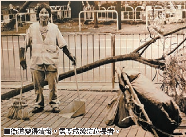
■街道變得清潔，需要感激這位長者。

以「活著」為主題的香港基層長者攝影展，正在深水埗汝州街269號舉行。攝影師以十八位長者的生活故事為素材，以生活誌的形式，用鏡頭記錄長者在當下的瞬間所展現的永恆的滄桑和期盼。活著，不僅僅是一種狀態，同時也是長者心中所期待的能夠不斷被延續的人生故事。這個故事的情節也許平靜，也許跌宕起伏，也許感人至深。無論是哪一種，都是長者們為自己的人生頁碼所關注的一個符號。