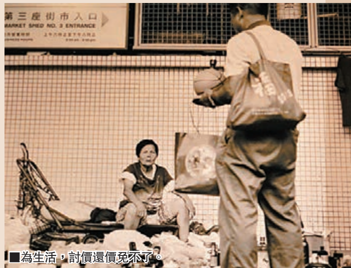
■為生活，討價還價免不了。