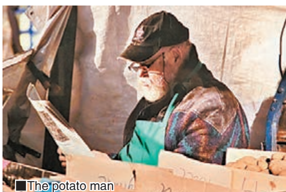
■The potato man