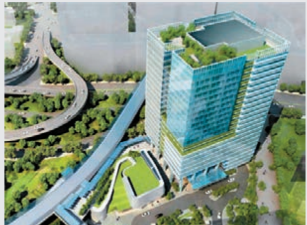
■計劃中的啟德工業貿易大廈料能節省 27% 能源消耗。