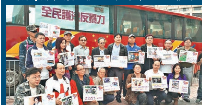
「珍惜群組」聯同建築界代表發起「全民護港反暴力」汽車慢駛遊行。