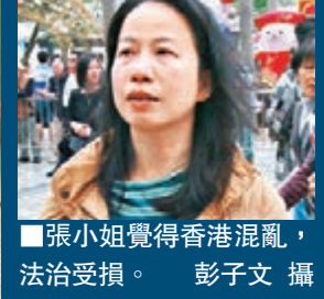
張小姐覺得香港混亂,法治受損。