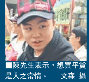
陳先生表示,想買平貨是人之常情。