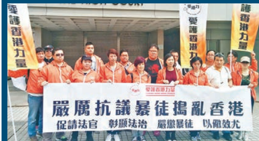
「愛港力」譴責暴徒亂港,促律政司及法官嚴懲滋事分子。