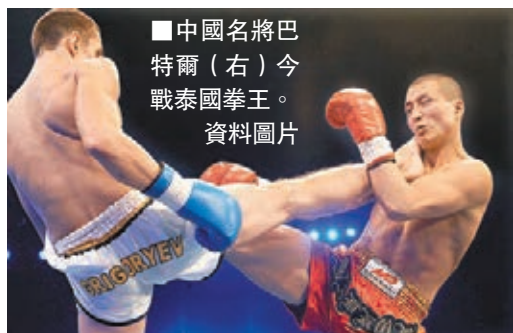
中國名將巴特爾(右)今戰泰國拳王。 資料圖片

香港文匯報訊(記者 敖敏輝 廣州報道)為慶祝中泰建交40周年，「嘉合傳媒盃」中國功夫VS泰國拳泰KO爭霸賽今日(15日)在廣州國際演藝中心上演，賽事組委會昨日上午為一眾拳手舉行隆重儀式。據悉，本次大賽將進行八場對決，共有四種規則，分別是自由搏擊、古泰拳「麻繩戰」、MMA和WBC拳擊規則，全部將以中國VS泰國的形式呈現。其中，中國名將巴特爾與泰國負盛名的拳王瀟殺狂上演精彩的自由搏擊戰，尤引人關注。