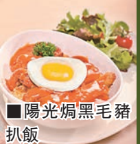
陽光焗黑毛豬扒飯