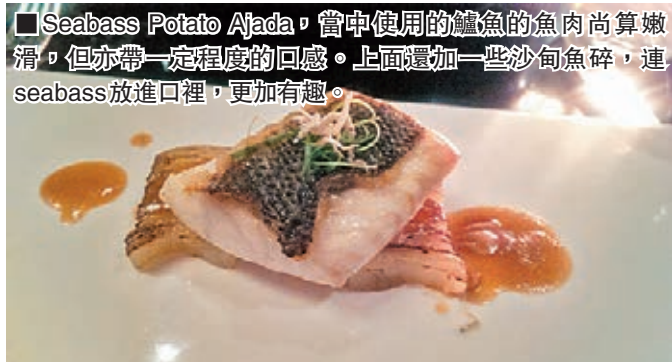
Seabass Potato Ajada，當中使用的鱸魚的魚肉尚算嫩滑，但亦帶一定程度的口感。上面還加一些沙甸魚碎，連 seabass 放進口中，更加有趣。