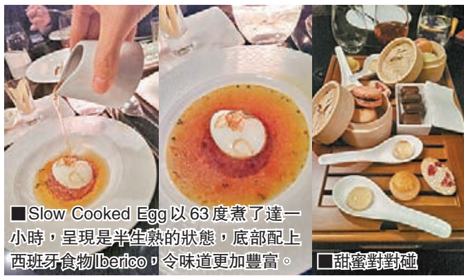
Slow Cooked Egg 以 63 度煮了達一小時，呈現是半生熟的狀態，底部配上西班牙食物 Iberico，令味道更加豐富。

海鮮愛好者定必不能錯過西班牙代表作——西班牙海鮮飯，由餐廳總廚以海鮮精心釀製的湯底炮製，加入多款海鮮，包括新鮮海蝦、鮮美肉厚的青口、大蜆及白滑彈牙的魷魚，為你驅走寒氣。由法式小圓餅、法蘭斯蛋糕、蜜糖橡皮糖、一口橘子醬及香滑朱古力組成的甜蜜對對碰，為這趟西班牙之旅劃上完美句號。