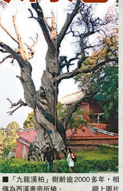
「九龍漢柏」樹齡2000多年，相傳為西漢惠帝所植。