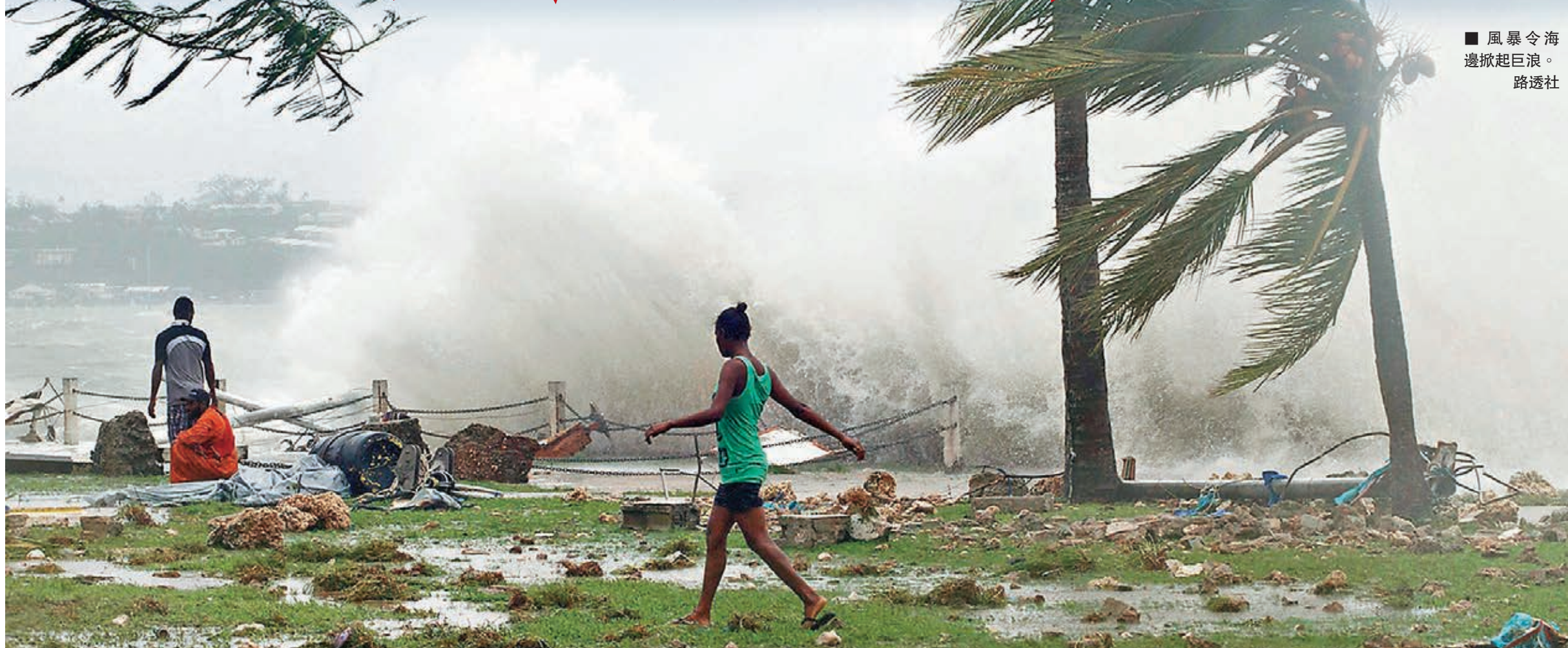
風暴令海邊掀起巨浪。

超強熱帶氣旋「帕姆」前晚正面吹襲太平洋島國瓦努阿圖，有官員形容威力堪比前年吹襲菲律賓的超強颱風「海燕」。狂風暴雨造成廣泛破壞，首都維拉港隨處頹垣敗瓦，目擊者稱猶如世界末日，偏遠地區更有整條村被夷為平地。聯合國事前估計災民或多達25萬，幾乎等同全國人口，而在風暴過後，未經證實消息指最少44人死亡。聯合國兒童基金會(UNICEF)稱「帕姆」可能是太平洋史上最慘烈風災之一。