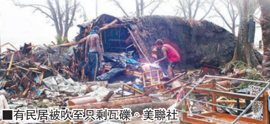
有民居被吹至只剩瓦礫。