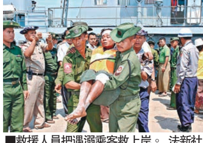
救援人員把溺斃乘客救上岸。