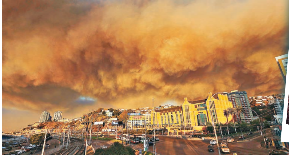
火山引發的濃煙，籠罩城市。