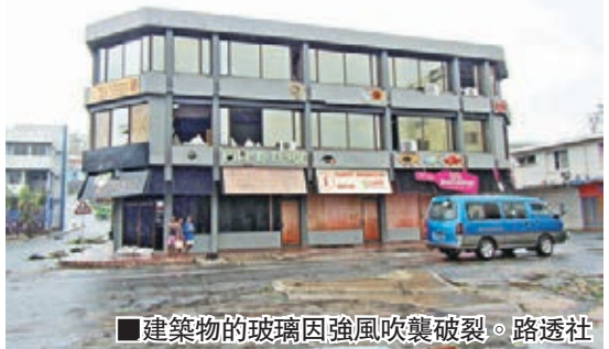
建築物的玻璃因強風吹襲破裂。