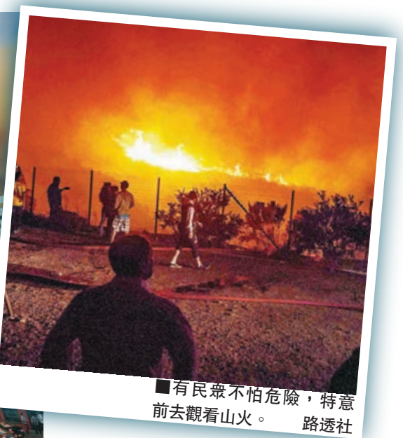
有民眾不怕危險，特意前去觀看山火。