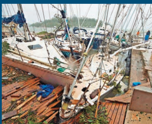
有快艇被吹上碼頭。