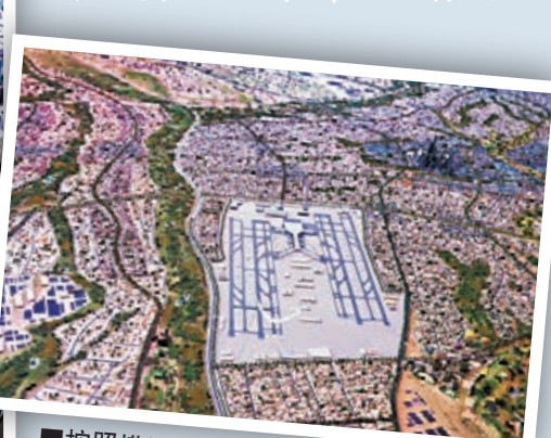
從模型所見，新首都將設有大型體育館。