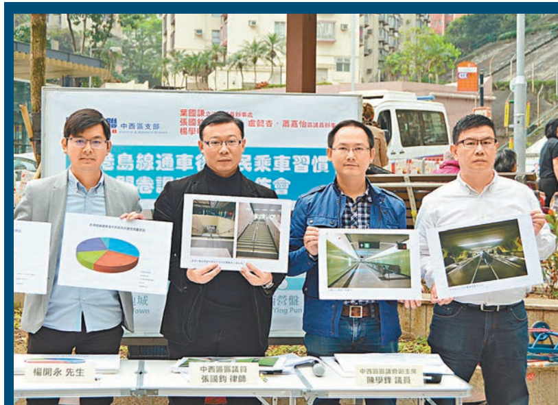
■民建聯中西區支部訪問逾600名西區居民，了解他們在西港島線通車前後的乘車習慣。

中西區區議會副主席陳學鋒則提出，將現時只在上下午繁忙時間服務的隧巴101X線擴展至全日服務，並提供紅隧轉乘優惠，及延長18P和43M線的走線，以方便更多居民乘搭。他又建議可增設多條來往堅尼地城和南區的特快專線小巴線，讓小巴乘客更便捷，班次亦可更頻密。