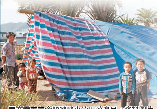
在雲南南傘躲避戰火的果敢邊民。資料圖片