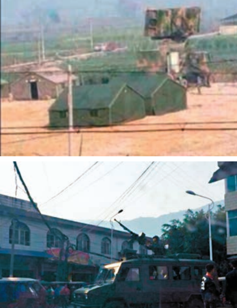
據網友拍攝的照片顯示，事發後解放軍出動戰車和直升機進入雲南孟定鎮。