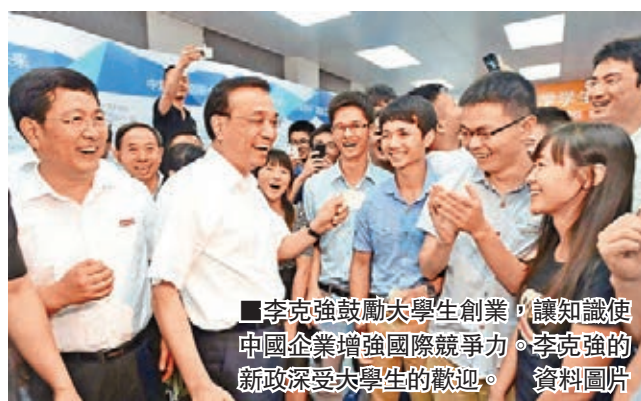
■李克強鼓勵大學生創業，讓知識使中國企業增強國際競爭力。李克強的新政深受大學生的歡迎。資料圖片

大眾創業創新營造更好的條件和環境。2014年，國務院和相關部委就出台了13個關於促進創業創新的文件，各部門已取消和下放了600多項行政審批事項，減少了三分之一的行政審批。並在全國推行商事制度改革，註冊資本從「實繳制」改為「認繳制」，取消最低註冊資本限制，一元錢就能開公司等多項舉措的推出，讓企業特別是中小微企業准入的門檻降低了，「緊箍咒」鬆了，極大地調動了全社會創業興業的熱情。2014年新登記註冊市場主體達到1,293萬戶，其中新登記註冊企業增長45.9%，形成了巨大的創業熱潮。今年，國務院又設立了總額在400億元人民幣的「國家新興產業創業投資引導基金」來助力創業創新。3月11日，國務院出台《指導意見》，對「大眾創業萬眾創新」在公共服務、財政支持、投融資機制等各方面予以支持。