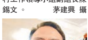
■全國政協常委、中央農村工作領導小組副組長陳錫文。