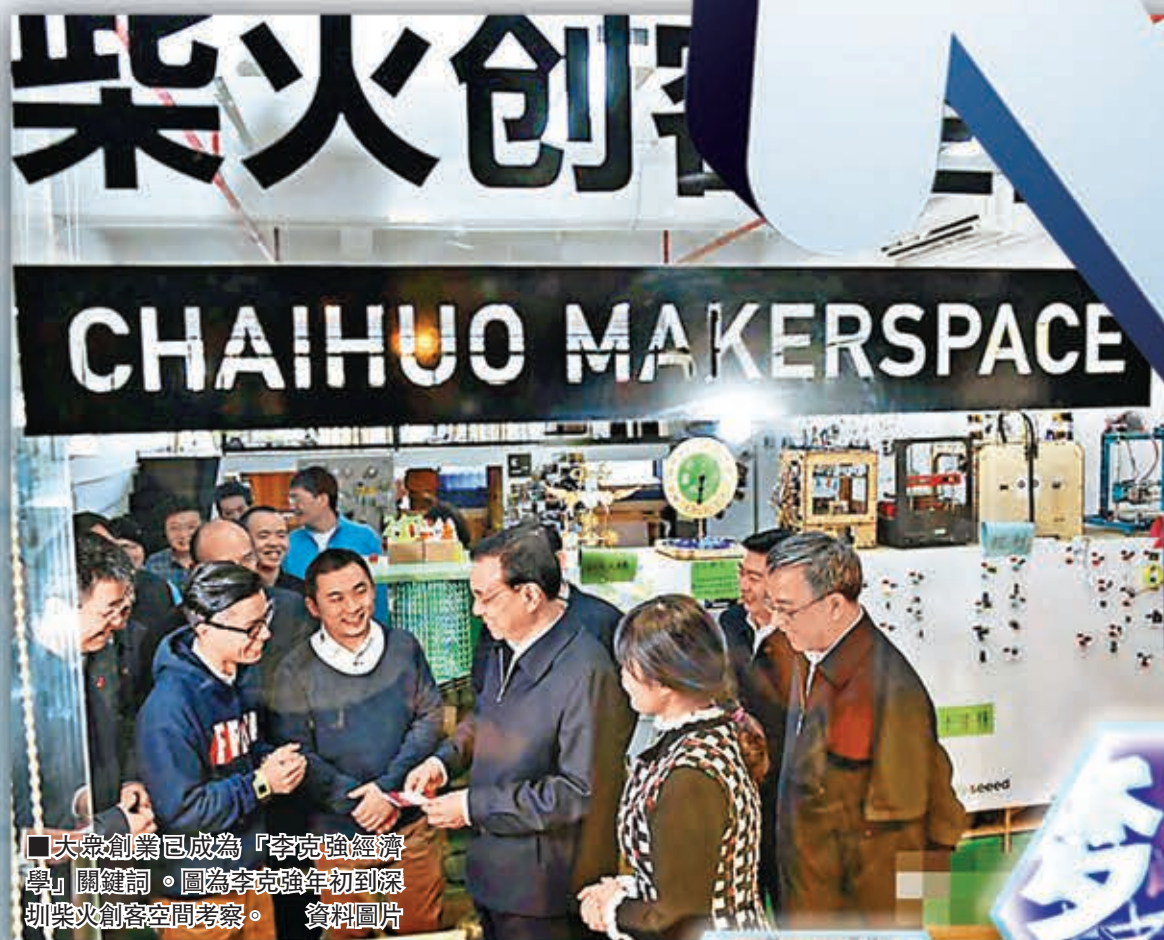
■大眾創業已成為「李克強經濟學」關鍵詞。圖為李克強年初到深圳柴火創客空間考察。

今年全國兩會，「大眾創業」、「萬眾創新」、「草根創新」的小故事，在代表委員口中津津樂道。浙江省科技廳廳長周國輝代表說，去年首屆世界互聯網大會上，基於「雲計算」命名的小鎮——杭州雲棲小鎮，吸引全球8,000多位創業者聚會，世界矚目。在這個2.28平方公里的彈丸小鎮，最大公司有2萬人，最小的公司才3人，一個90後叫余佳文的學生，「玩」出了一款叫做「超級課程表」的客戶終端，正在被中國3,300萬大學生頻繁使用。「去年阿里巴巴的IPO，激發了互聯網從業人員創業熱情，杭州市正實施的國家自主創新示範區和跨境電商綜合試驗區，都是以互聯網為基礎。香港大學在杭州青山湖科技城已落戶的香港大學研究院，馬上成立三個研究所，很多科技研究成果將與浙江民企合作開發。每一個「創客」都可成為推動浙江經濟發展的新細胞。」