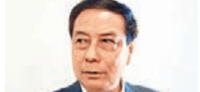
■全國人大代表、浙江省科技廳廳長周國輝。

李強心中的創業創新不限於備受鼓勵的大學生創業，紅火的互聯網創新。在兩會期間的一次政協聯組會上，李強特別舉了一位老太太辦婚慶公司的創業例子，這位老太太去相關部門提交手續籌辦婚慶公司，引起當地工商等部門的不解，原來老太太太懂得當地辦婚禮的老禮數，這是她的核心競爭力。這也許正是大眾創業的最好例子。正如李強在政府工作報告中所說，我國有13億人口，人民勤勞和智慧，蘊藏着無窮的創造力，千千萬萬個市場細胞活躍起來，必將匯聚成發展的巨大動能，一定能夠頂住經濟下行壓力，讓中國經濟始終充滿勃勃生機。