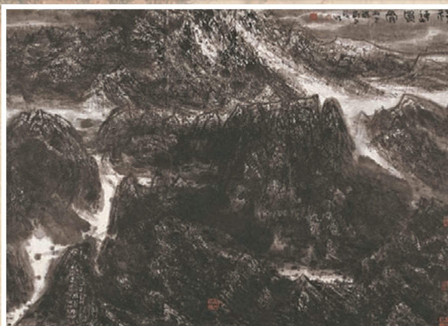
■祁連風骨 (1996年, 134 x 192.5cm)