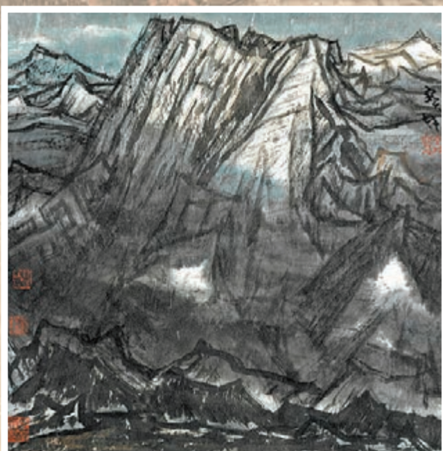
■傲立 (2003年, 71 x 71cm)