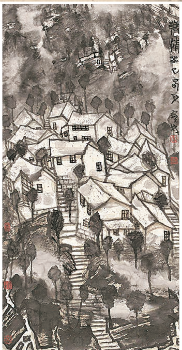
■鄉情 (2013年, 131 x 66.5cm)