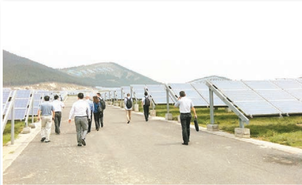
■惠理在過往廿多年來一直秉承「價值投資」的哲學，着重研究企業的基本因素，投資團隊每年進行約1,000次公司考察及調研，尋找具投資潛力的公司。圖為惠理分析員考察一家能源企業的實況。