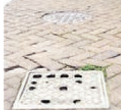
人行道上密佈的窰井蓋。網上圖片

在浙江省寧波市,近日,有網友發了一條名為「一條270米人行道密佈260個窰井蓋」的帖子,引發了廣泛關注。