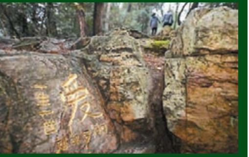
記者 李青霞 長沙報道

有網友近日在湖南岳麓山景區發現一處被刻上「愛」字的岩石。岳麓山風景名勝區相關負責人表示,將迅速組織人員進行修復,同時啟動執法程序,找出當事人,依法進行處罰。