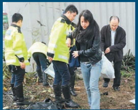
事後趕到現場的身亡機師家屬。