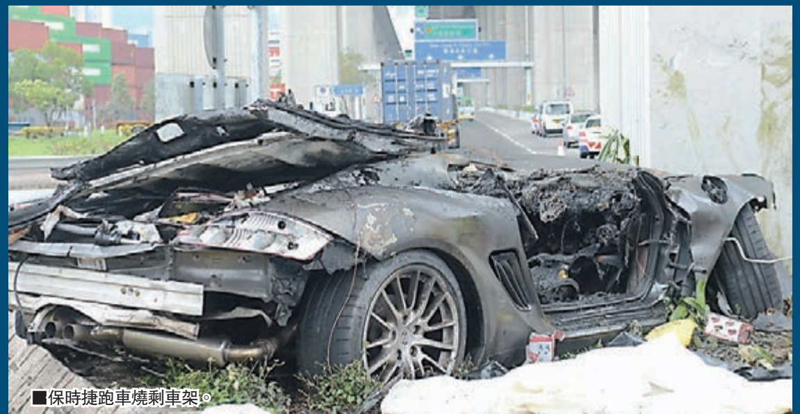
保時捷跑車燒剩車架。