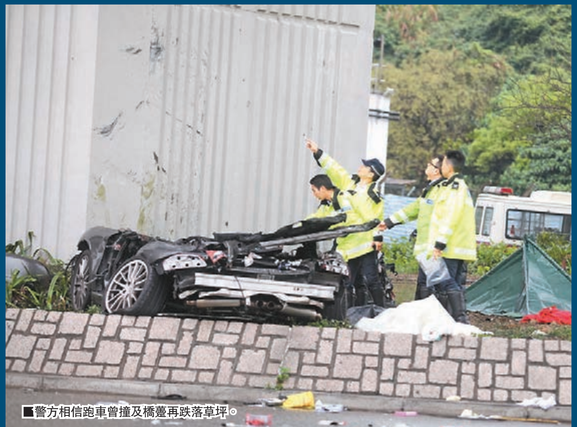
警方相信跑車撞及橋躉再跌落草坪。