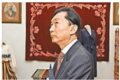
■鳩山參觀克里米亞的少數族裔博物館。