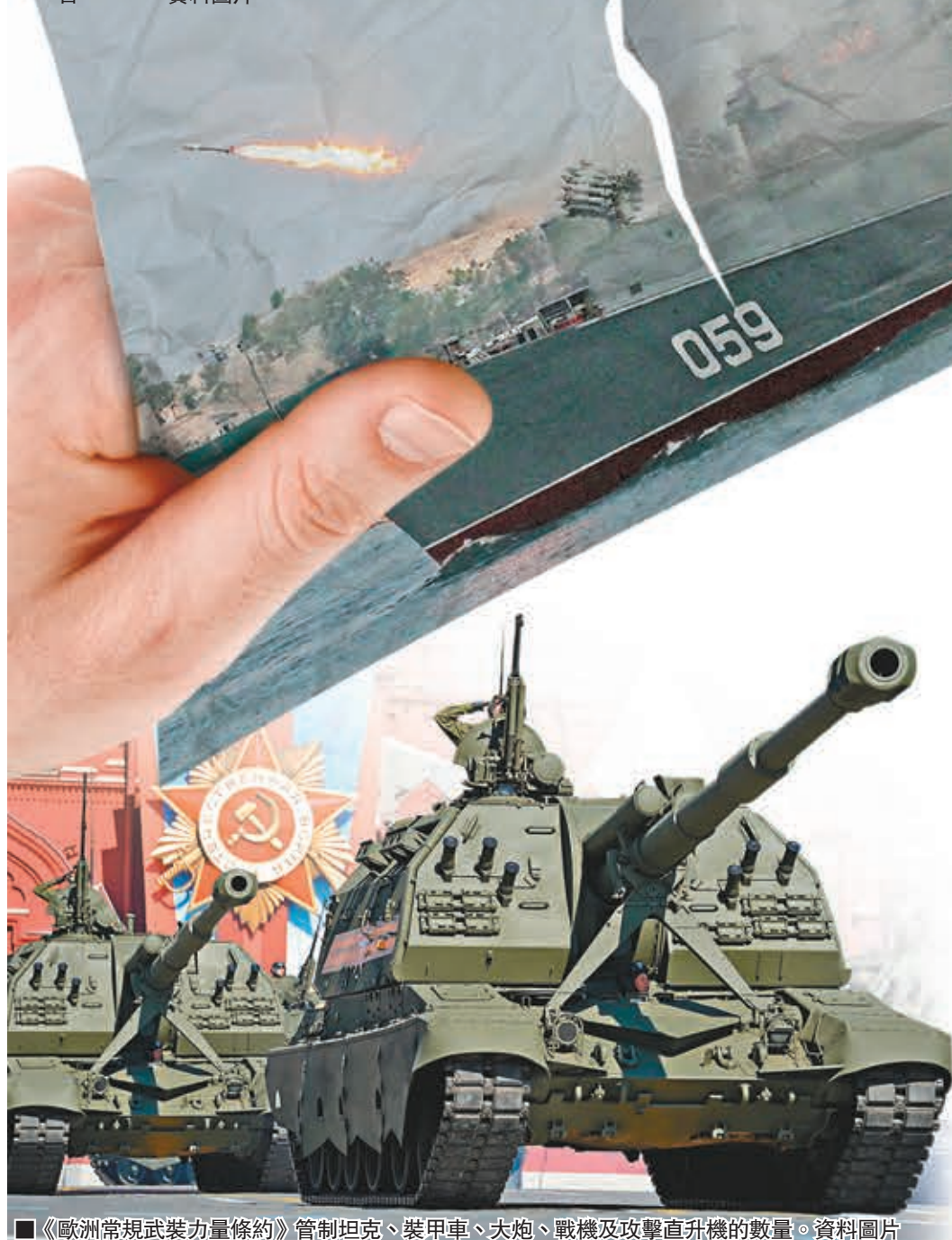
《歐洲常規武裝力量條約》管制坦克、裝甲車、大炮、戰機及攻擊直升機的数量。資料圖片