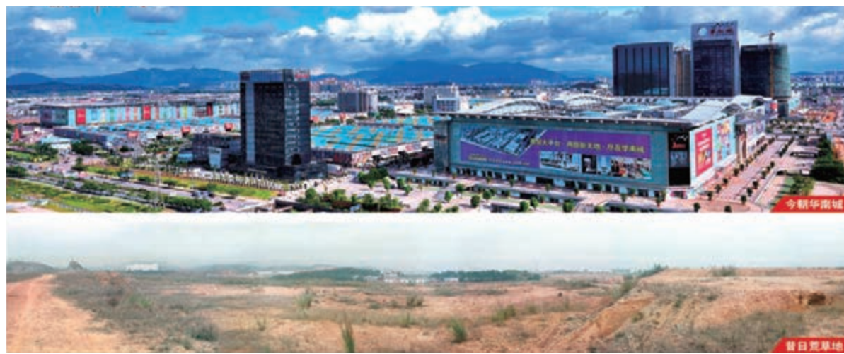
昔日荒地，今朝華南城。

作為首批進駐華南城的商家，興發皮革的老闆可謂是最早的受益者。他告訴記者，隨着華南城的營銷平台建設不斷完善，他店鋪的營業額也從開業初期每月四千元，上漲到現在的二十多萬元。「現在我有5個業務員專門跑客戶，下一步，我準備利用華南城的電子商務平台『拉客』。」