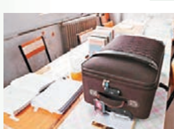
學生將行李箱放在桌上佔座。網上圖片

在河南省鄭州市，伴隨着寒假的結束，高校考研學子一年一度的「佔座大戰」又開始了。近日，在鄭州某大學的一棟教學樓上可以看到，樓內考研自習室的所有座位都被各種方式佔住，而牆上張貼着的《自習室使用管理辦法》明確指出「嚴禁用物品佔座位」。