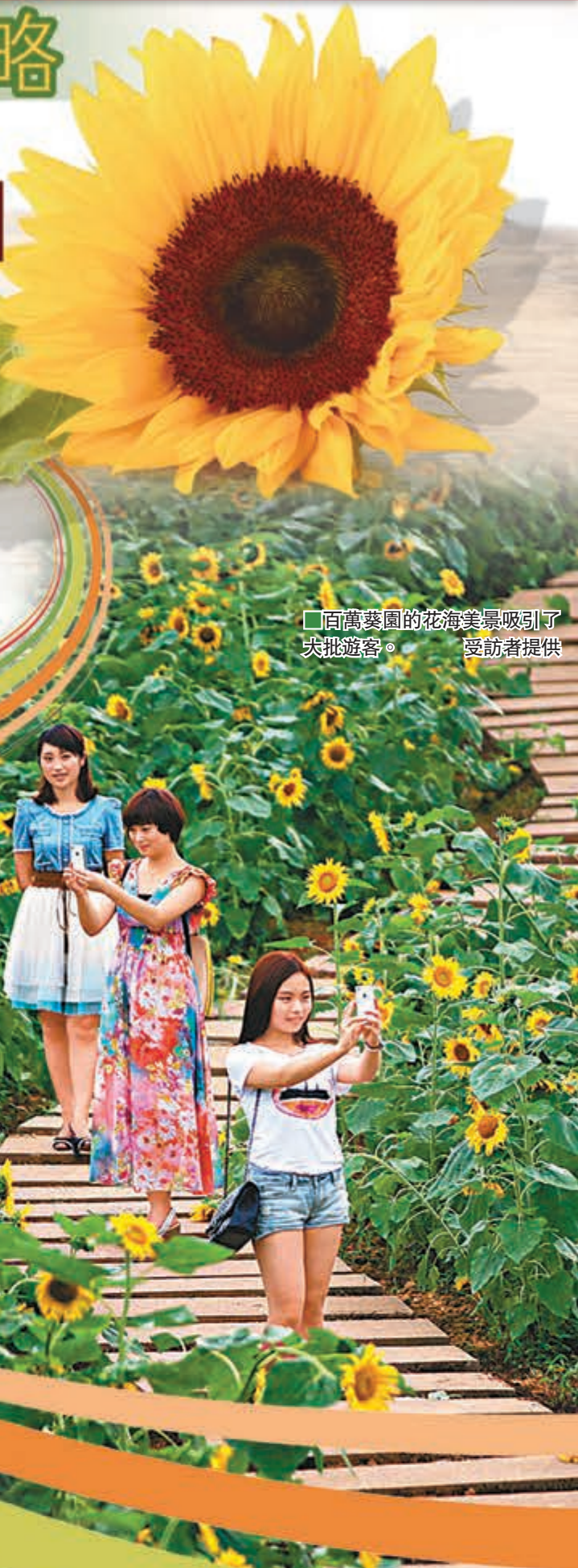
百萬葵園的花海美景吸引了大批遊客。

★不能錯過的美食：「葵花雞燉湯」和「清蒸葵花雞」最有名。另外，蓮藕炒鴨肉、蓮藕炒鴨肉、南乳炒藕片都是當地的名菜，還有附近的十九涌吃生猛河鮮與沙灣薑撞奶。