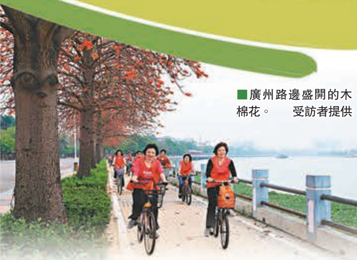
廣州路邊盛開的木棉花。