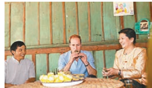
威廉王子在傣族村民家品嚐粽子。譚旻煦 攝