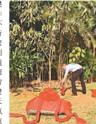
威廉王子翻土植樹。 網上圖片

香港文匯報訊（記者譚旻煦西雙版納報道）威廉王子昨日在西雙版納的行程滿滿，不到9個小時的時間裡，王子行程260餘公里。儘管時間緊迫，威廉還是來到29年前菲利浦親王種下友誼樹的地方，親手種下了一棵新的友誼樹。據悉，29年前，伊麗莎伯二世曾到訪雲南，菲利浦親王在西雙版納植物園種下了一棵望天樹，現在這棵樹已經漸成氣候。威廉在這棵望天樹不遠處，種下了一棵五桠木，這種樹的果實是野生亞洲象喜愛的食物，有網友感慨，王子真不愧是象「粉絲」。