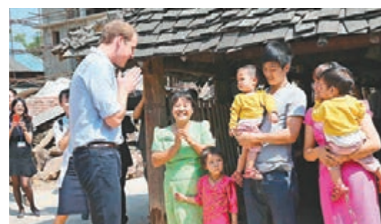
威廉王子用傣族方式向村民打招呼。

威廉說，中國政府禁止公務宴請使用魚翅、燕窩及野生動物舉措的積極影響，得到了全世界的贊同。他同時再次呼籲停止象牙消費。在與青年學生代表交流後，威廉王子順利結束行程於當晚返程。