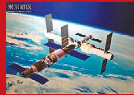
天宮二號效果圖。 網上圖片

來自港澳地區，以及國外的航天員進駐。此前，神舟九號和神舟十號都有女航天員駐留。目前航天員正在根據任務需要進行訓練，飛行乘組尚未最後確定」。 據了解，天宮二號發射前，中國將在海南發射場發射新研製的長征七號運載火箭的試驗箭，其後該火箭將被用於發射天舟貨運飛船。周建平說，長征七號是中國新型運載火箭，天舟貨運飛船也是全新的飛行器。先發射長征七號的試驗箭是為了驗證長征七號運載火箭設計方案的正確性以及功能、性能等。而天舟貨運飛船的任務是向空間站運送推進劑，航天員生活用品、食品和其它消耗品，建造空間站以及在空間站上開展科學研究的儀器、設備、樣品、器材等。 據悉，中國載人航天團隊於2011年9月成功發射天宮一號以來，天宮一號先後與神舟