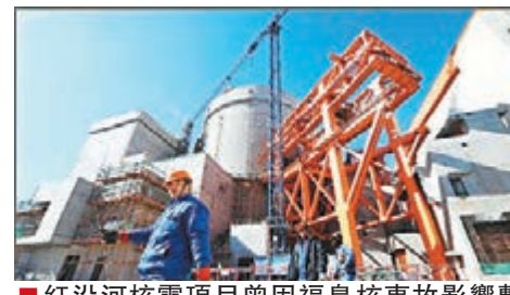
紅沿河核電項目曾因福島核事故影響暫停了2014年至今首個獲批的核電項目。

香港文匯報訊 據《每日經濟新聞》報道，媒體昨日從多位核電權威人士處獲悉，今年2月17日，遼寧紅沿河核電站5、6號機組正式在國務院辦公廳會議上獲得核准開工，國務院總理李克強最後圖批通過，這意味著紅沿河核電二期工程走完了政府核准層面所有的程序，成為了2014年至今首個獲批的核電項目。業內認為，這標誌着國家核電正式重啟，這是繼2012年12月台灣核電二期工程之後，時隔兩年多，中國政府重新核准核電新項目開工建設。 據悉，國家能源局局長努爾·白克力近日也已批覆該項目，並交由核電司具體經辦，按照程序，發改委能源局將發函告知相關單位及政府部門批覆的情況。據此前報道，沿海核電項目有望在2015年第一季度獲批，內陸核電或於2016年進行試點。 資料顯示，紅沿河核電站是目前東北地區唯一一座核電站，一期工程中的1、2號機組已併網發電，3、4號機組處於建設期，預計今年正式投運。二期工程的5、6號機組在技術路線方面穩定成熟，安全指標符合三代核電標準。同時，二期工程在2010年就已獲得開展前期工作的小路條，後因日本福島核電事故影響暫停。