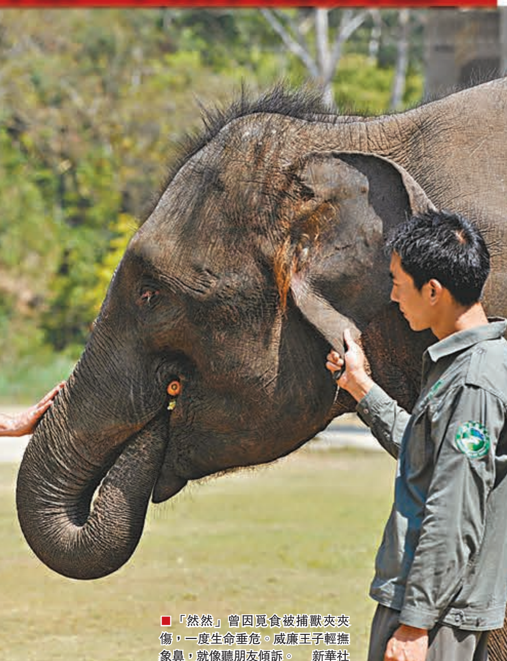
「然然」曾因覓食被捕獸夾夾傷，一度生命垂危。威廉王子輕撫象鼻，就像聽朋友傾訴。