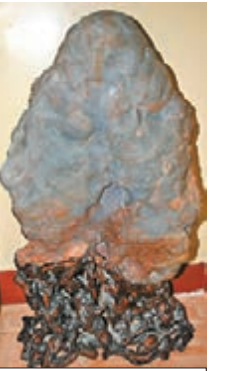
■銀川瑪瑙「聖誕老人」奇石。網上圖片

寧夏回族自治区銀川市一收藏愛好者展示了一塊瑪瑙奇石「聖誕老人」。該石產於內蒙古阿拉善左旗，高80厘米，寬42厘米，厚12厘米，風刻雨雕，天琢神磨，酷似「聖誕老人」。