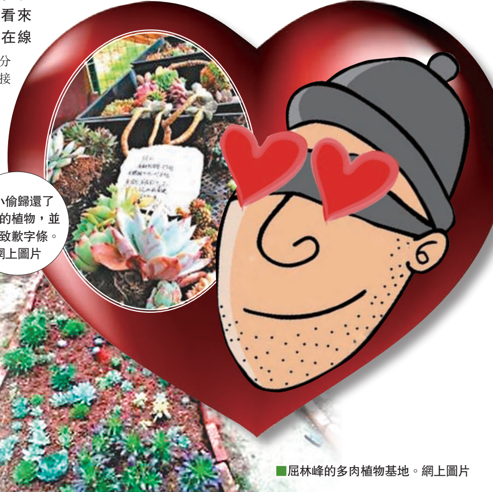
■屈林峰的多肉植物基地。