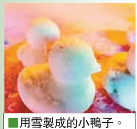
■用雪製成的小鴨子。

「每天下班，都能看到她親手做的小雪鴨子送給路人，今天我也拿到一隻，瞬間覺得自己童心未泯，小妹妹實在太可愛啦！」近日，在黑龍江哈爾濱市群力區興江路上有一位10歲的小蘿莉，從大年初二起，幾乎每天都在路邊用白雪做出近50隻雪鴨子，並把它們送給路過的孩子或年輕人。