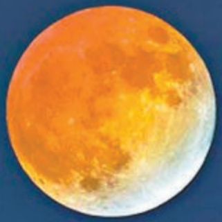
■羊年的元宵月依然是「十五的月亮十六圓」。

3月5日是羊年農曆元宵佳節。天文專家表示，繼馬年之後，羊年的元宵月依然是「十五的月亮十六圓」。