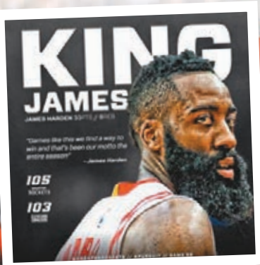
■火箭在官網讚揚夏頓是「皇帝」。網上圖片