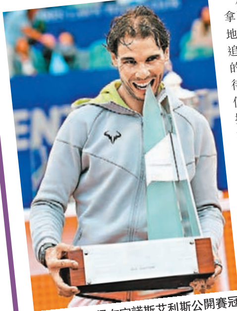
■拿度贏得布宜諾斯艾利斯公開賽冠軍。

西班牙「泥地王」拿度周日在布宜諾斯艾利斯公開賽決賽，以6:4和6:1的盤數輕鬆擊敗阿根廷球手蒙納