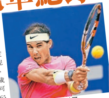
■拿度在決賽擊敗蒙納哥。

拿度賽後說：「這對每個人來說都是很複雜的一天，對我和蒙納哥都是，特別是對等待的球迷來說，