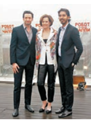
■澳洲男星曉治積曼(Hugh Jackman)前日夥同薛歌妮韋花(Sigourney Weaver)和 Dev Patel 現身莫斯科。