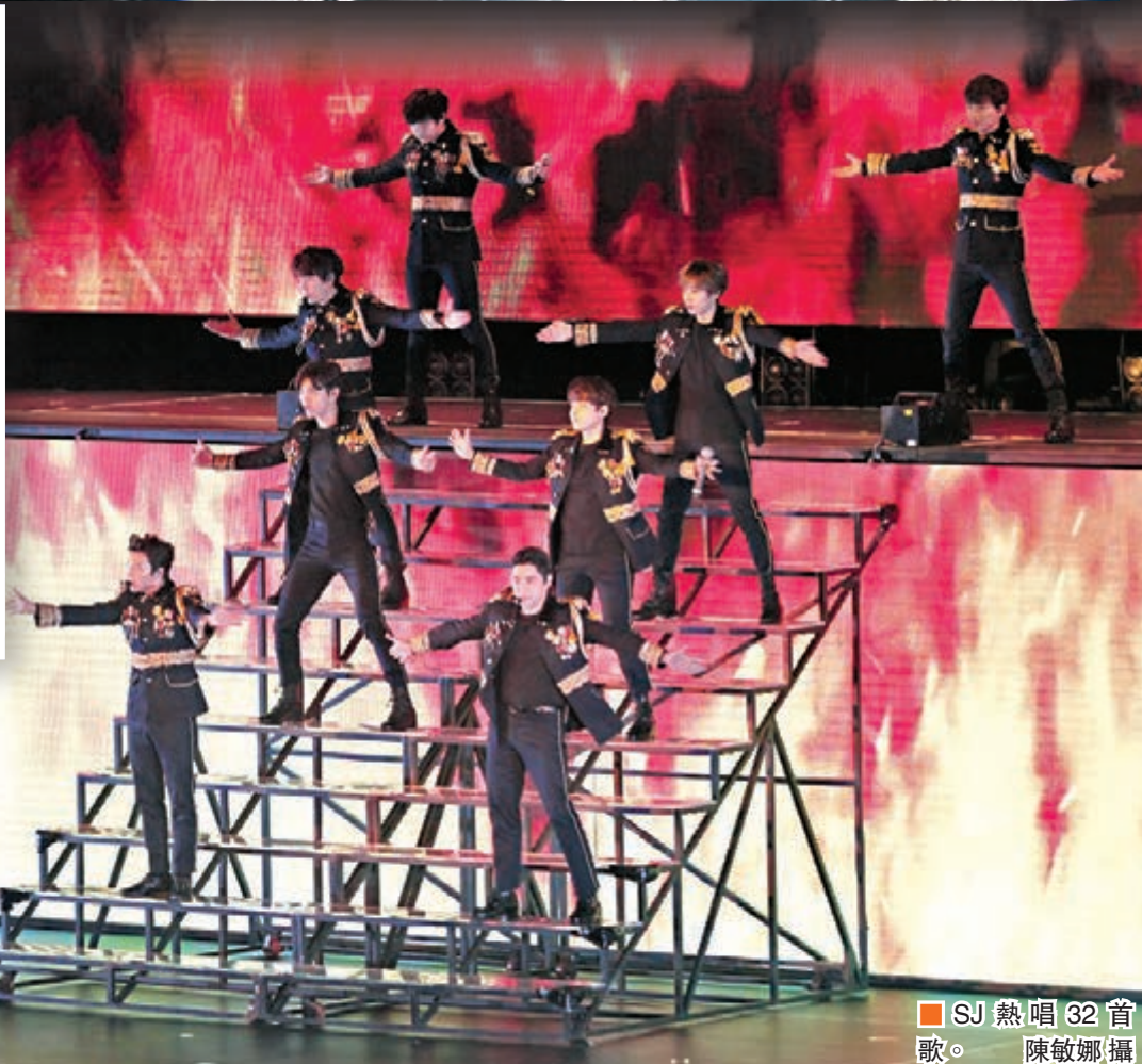
■SJ 熱唱 32 首歌。