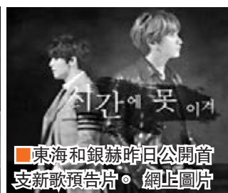
■東海和銀赫昨日公開賞支新歌預告片。

當晚，SJ以《Twins》打頭陣，揭開演唱會序幕，熱唱 32 首歌，當中包括《Sorry, Sorry》、《Mr. Simple》等多首大熱作，不過，不知道是否因要趕飛機，始源露點扮白馬的個人環節卻臨時取消，略為可惜。