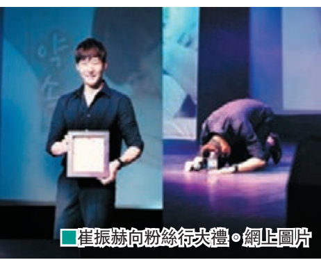
■崔振赫向粉絲行大禮。網上圖片

曾主演韓劇《急診男女》的韓星崔振赫將於本月 31 日入伍，以陸軍服役，上周六在首爾舉行入伍前最後一場粉絲見面會，並向粉絲磕頭道歉。 當天大批粉絲前去為崔振赫送別。見面會上，崔振赫又唱又跳，更送贈玫瑰杯粉絲，粉絲們也給偶像準備了禮物，他們高舉著「崔振赫，只有你」的手幅，表示一定會等崔振赫平安回來，崔振赫承諾一定會好好服完兵役回來，他感動鳴謝道：「我原來淚水比較多，但今天不希望落淚，要笑着堅持到最後。」說罷，崔振赫甚至跪在地上，向粉絲叩頭行跪拜大禮，以示對粉絲多年來支持的感謝，台下的粉絲們頓時哭成一片，場面感人。至於有關入伍地點等細節，崔振赫經理人公司表示，由於崔振赫本人不想對外公布，故不會公開。