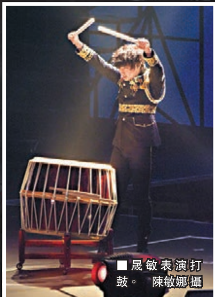
■晟敏表演打鼓。陳敏娜攝

香港文匯報訊(記者 陳敏娜)韓國人氣組合 Super Junior(SJ)前晚假澳門威尼斯人酒店舉行其「Super Show 6 世界巡迴演唱會澳門站」，吸引不少粉絲捧場。當中隊長利特身穿低胸短裙，反串扮《魔雪奇緣》的Elsa公主時，慘被隊友圍攻扯裙，上下失守，露點兼露底。而即將本月底入伍的晟敏則發表入伍前感言，強調會健康地歸隊，粉絲不用掛心。