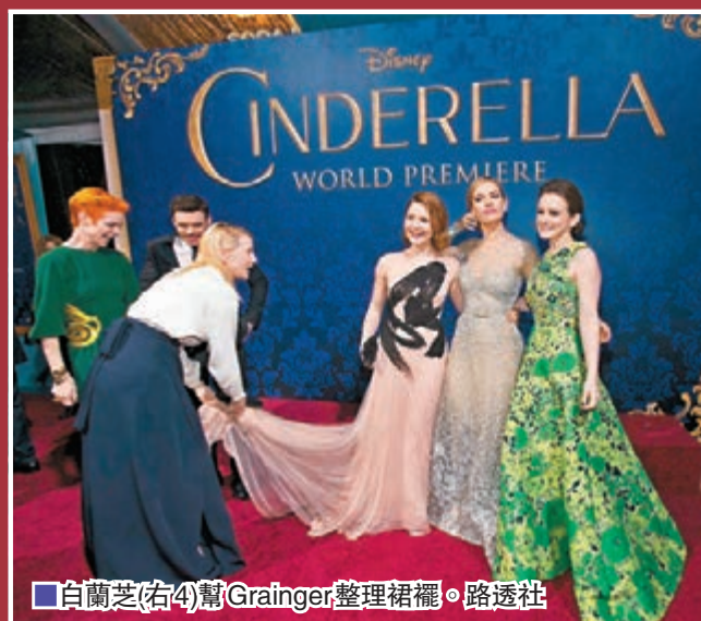
■白蘭芝(右4)幫 Grainger 整理裙襪。

另外，當眾演員影大合照時，影后級人馬白蘭芝見女星 Holliday Grainger 的裙襪沒有整理好，舒尊降貴地幫對方整理，表現親切。她接受訪問時，談到今次接拍動機，稱一向喜歡童話故事，但現在的故事太過着墨於英雄主義，令兒童誤以為英雄是無所不能，世界是完美的。她盼透過新作，讓兒童認清世界亦有黑暗的一面，需要大量的勇氣和毅力才能生存，而且強調善良才是最重要。