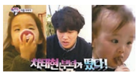
■車太賢攜兩女探望嚴泰雄。

韓國男星車太賢在前日播出的綜藝節目《超人回來了》中，攜同兩名女兒探望好友嚴泰雄。他在節目中，對女兒們非常細心，不少觀眾看畢後，均希望他可成為固定班底，而當日《超人回來了》亦以超過 16 點的收視率成為該時段的冠軍。不過，節目製作人表示因車太賢是《兩天一夜》的固定成員，而《兩天一夜》接着《超人回來了》播出，因不能讓他接連出演兩個節目，故一開始已排除邀他出演的計劃。