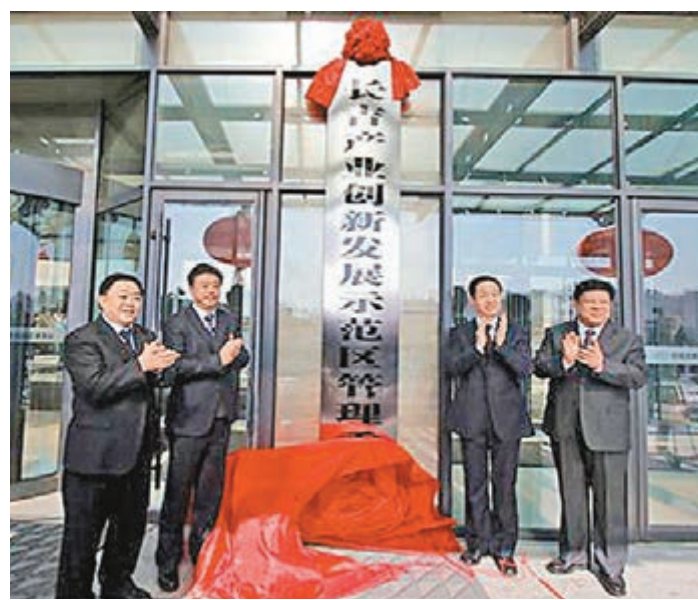
長吉產業創新發展示範區揭牌。 本報吉林傳真

據了解，長吉產業創新發展示範區規劃面積控制在3,710平方公里以內，規劃範圍包括長春東北和吉林市產業發展示範區兩個相連區域。為盡快啟動長吉產業創新發展示範區建設，在長東北和吉林市產業發展示範區兩個區域分別確定了若干區域作為先導區優先開放建設。