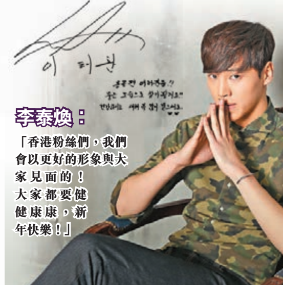
李泰煥：「香港粉絲們，我們會以更好的形象與大家見面的！大家都要健康康康，新年快樂！」