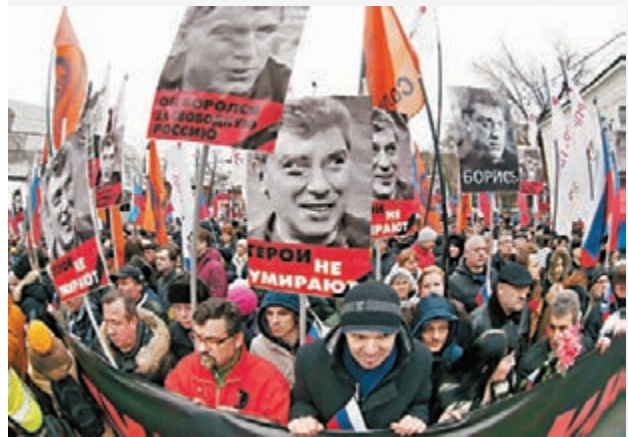
逾7萬人在莫斯科悼念涅姆佐夫。

據悉杜麗茨卡婭的口供僅指二人當晚相約在附近一個商場晚膳，11時多離開，之後沿克里姆林宮附近河畔散步，途中涅姆佐夫在一條橋上遭人暗殺。俄羅斯政府指涅姆佐