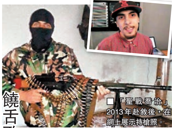
饒舌歌手或為「聖戰喬治」