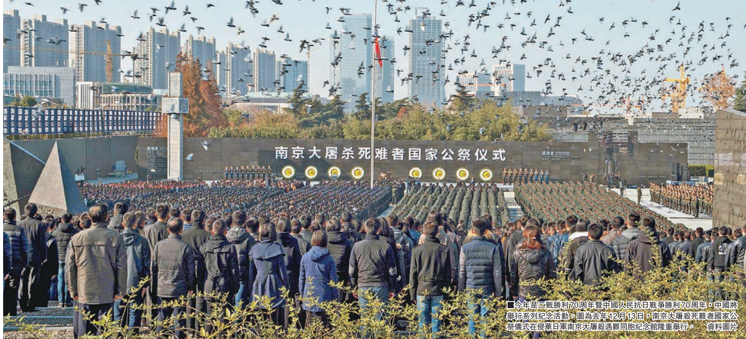
今年是三戰勝利70周年暨中國人民抗日戰爭勝利70周年，中國將舉行系列紀念活動。圖為去年12月13日，南京大屠殺死難者國家公祭儀式在侵華日軍南京大屠殺遇難同胞紀念館隆重舉行。資料圖片

今年是世界反法西斯戰爭勝利70周年，亦是中國人民抗日戰爭勝利70周年，中國外交將迎來新戰場。作為戰勝國之一，中國將如何與國際社會一道捍衛戰後成果，備受世人矚目，料成為全國兩會期間的熱門話題。外界預料，邀請外國元首觀看閱兵式、南京大屠殺死難者國家公祭、向人民英雄紀念碑獻花、在抗戰勝利紀念日和聯合國成立70周年等場合發表講話、中美及中俄高層互動等，都將是中國外交新戰場上系列活動的重要內容。