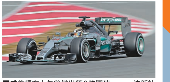
威美頓在上午曾做出第3快圈速。

麥拿命車隊周四在巴塞爾那第3次季前測試首日再遇阻滯，去年世界冠軍威美頓的戰車出問題，整個下午只能呆在車房；而威廉士車隊的馬沙則完成超過100圈，並做出全日最快圈速1分23秒500。