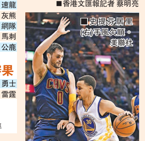
史提芬居里(右)手風欠順。

騎士全明星後衛艾榮是役有24分進帳，不過在第3節不慎弄傷左肩，為安全起見，艾榮不會隨隊作客印第安納溜馬，周五將進行磁力共振檢查。