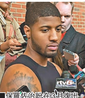
保羅佐治(左)在3月復出。網上圖片

去年8月在美國男籃訓練營弄斷右腿的溜馬球星保羅佐治，周四完成首課完整訓練，這名24歲前鋒坦言希望可在3月復出。保羅佐治在訓練後說：「感覺真的很好，我仍希望3月可復出，目前我還需要克服一些障礙，但這是我的目標。」溜馬主教練不基爾則表示保羅佐治沒有復出時間表，現時還有很長的一段路才可完全復出比賽。