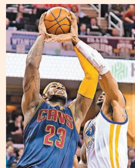
勒邦占士(左)打出MVP表現。

面對雄踞西岸首位的勇士來襲，「大帝」勒邦占士大發神威，轟進個人今季新高的42分，率領騎士周四在主場以110:99臣服勇士，贏下近20仗的第18場勝利。占士賽後否認今仗呈勇是要挑戰勇士後衛史提芬居里，爭奪MVP寶座，只是一心為球隊爭勝。