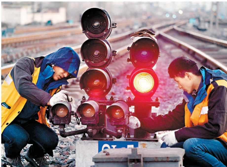
不少網友留言呼籲給教師、基層公務員、技術工人等基層工作者提高工資待遇。圖為兩名技術工人在調試新安裝的信號設備。

關於去年哪項反腐工作最受網民認可，「打老虎」位居第一。從具體數字看，有19.79%的網友選擇「查處周永康、徐才