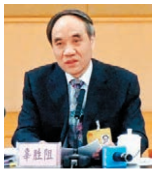
民建中央副主席辜勝阻。