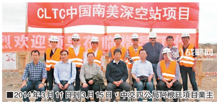
2014年3月11日到3月15日，中委四公局阿根廷項目業主北京總部及西安衛控中心聯合代表團訪問了阿根廷。

香港文匯報訊 當地時間25日，阿根廷國會批准在該國南部建造一個中國衛星跟蹤站。據美聯社26日報道，參議院後，阿根廷眾議院25日以133票贊成、107票反對通過該議案。報道稱，衛星跟蹤站將建在阿根廷南部省份內烏肯，佔地200公頃，預計耗資3億美元，計劃於2016年投入使用。該衛星跟蹤站將通過一根直徑35米的天線監測和下載數據。作為中阿協議的一部分，阿根廷將獲得衛星天線10%的使用權，即有權在衛星天線的可用時間內進行本國研究項目。衛星站的技術人員由中方提供。據美國福斯新聞網報道，阿根廷政府說，這個項目是中國2020年登月工程的一部分，是中國為太空探索項目而在國外建造的首個基地。