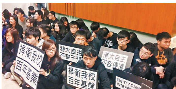
港大學生會發起靜坐行動，數十名身穿黑衣的學生在校務委員會會議前後包圍會議室「施壓」。

現在港大學生會的行徑不打自招，說明他們才是不斷向校委會施壓，挑動遴選風波為陳文敏抬轎的黑手。如果不是這些人不斷將遴選工作政治化，以陳文敏的能力往績，有可能擔任副校長嗎？究竟誰在政治施壓，誰在干預遴選，至此終於一清二楚。