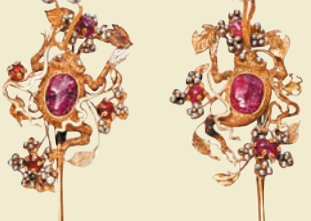
明萬曆年的鑲嵌紅寶石金蟾髮簪

另一件精品是來自越南9至14世紀古城的一對圓珠紋路的24K金手鐲，因24K的黃金質地柔軟，故金手鐲的鐲身有一開口，從中注入漆來增強金手鐲的硬度，來支撐整個鐲身。Sue介紹，參展的還有來自印度17世紀鉑金鑲嵌56卡綠寶石戒指，越南原石鑲嵌藍寶石戒指等。