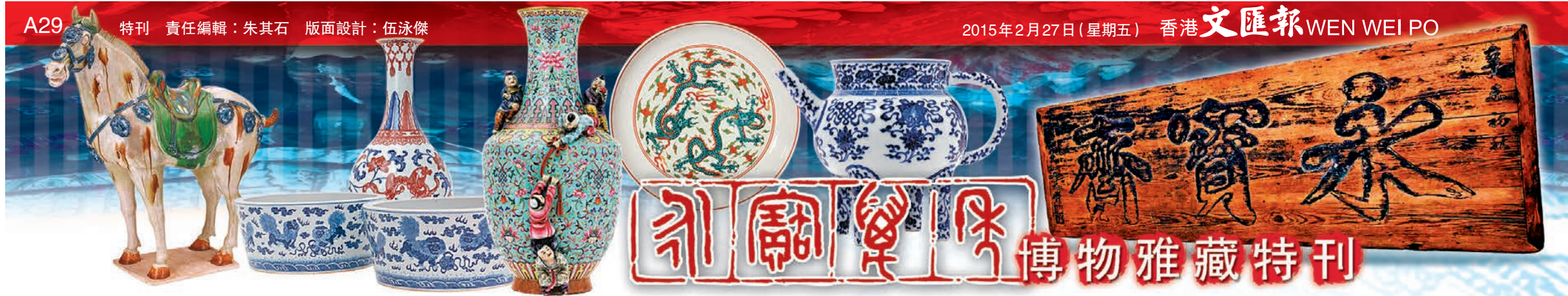
紐約佳士得將拍的明代掐絲琺瑯雲龍紋大蓋罐