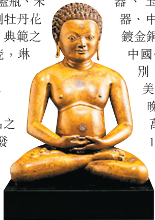
安思遠珍藏的西藏青銅大成就者像

「昭令德」為首個呈獻各式銘物鑒品之專場拍賣，追溯中國文字與書法的藝術發展。該專場囊括不同媒介及年代之雅逸精品，當中包括商代甲骨文，為中國史上最早期的文字紀錄；早期青銅禮器及銘刻銅鏡；新文石碑；銘刻陶瓷及漆器，以及乾隆御製玉璽，更呈獻古代石刻墨硯，以及靈感取自古代