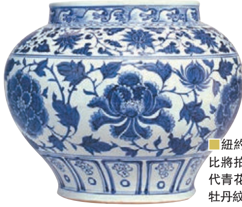
紐約蘇富比將拍的元代青花纏枝牡丹紋罐

重要中國瓷器及工藝精品專場的一件外觀宏偉，色彩斑斕，極為罕見的大型明代十五/十六世紀掐絲琺瑯雲龍紋大蓋罐備受矚目。掐絲琺瑯稱景泰藍，這件