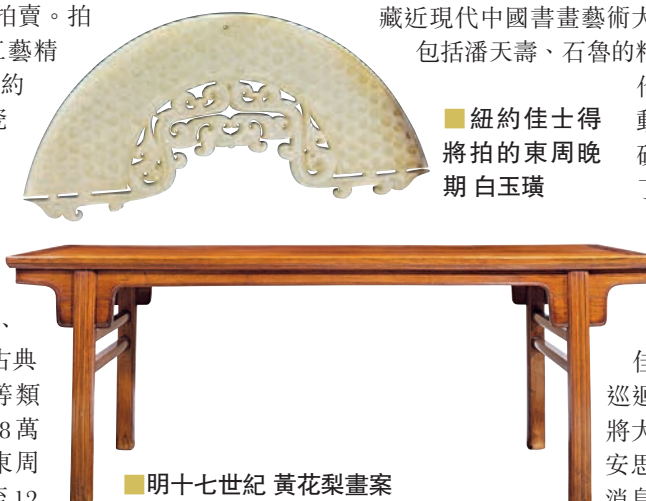
明十七世紀黃花梨畫案

佳士得舉辦巡迴展並發佈將大規模上拍安思遠藏品的消息後，不少藏家均表示，必須到現場去。以往的紐約亞洲藝術周，華人舉牌競拍的身影越來越多，在下午的紐約佳士得拍場中，或將掀起一場華人搶拍藏品的硝煙。紐約佳士得還將採取現場拍賣與網上競買的方式結合進行，有一部分藏品會通過網上來做獨家渠道的拍賣，如果沒有機會來到紐約，沒有辦法來到現場競拍，大家可以通過網上的方式體會或者接觸到安思遠的藏品。