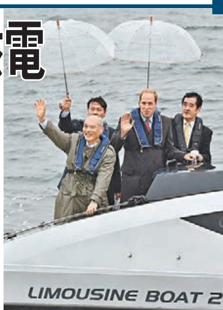
威廉乘船(右圖)欣賞東京灣景色後，與外添要一品嚐茶道。