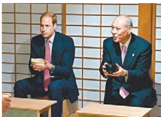
威廉乘船(右圖)欣賞東京灣景色後，與外添要一品嚐茶道。