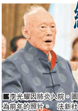
李光耀因肺炎入院。圖為前年的照片。

現年91歲的新加坡國父李光耀本月5日因為嚴重肺炎入院後，在加護病房接受治療，病情備受外界關注。網上前晚一度傳出他的死訊，促使新加坡總理李光耀迅速關謠，澄清李光耀仍然在生，並於昨日發聲明公開他的最新情況。 聲明指李光耀仍於新加坡中央醫院深切治療部留醫，繼續服用鎮靜劑及用儀器協助呼吸。