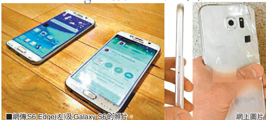
網傳S6 Edge(左)及Galaxy S6的照片。

「世界流動通訊大會」下周一起在西班牙巴塞隆那舉行，據報韓國三星電子將在開幕前一天的特別活動上發布最新旗艦手機Galaxy S6及彎曲屏幕版本的S6 Edge。消息指，128GB版S6 Edge定價可能高達1,049歐元(約9,182港元)，較蘋果iPhone 6 Plus還要貴，加上盛傳彎曲屏幕生產線 遇上問題，意味手機應市後短期內可能出現供應短缺，或助長炒風。 據悉兩款新機將捨棄此前劣評如潮的塑膠外殼，改用全金屬外殼。新機將內置無線充電功能，預料可同時支援WPC等不同無線充電標準。