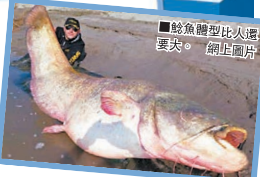
鯰魚體型比人還要大。

意大利一對兄弟上星期四於北部波河釣到一條長9呎、重達127公斤的巨型鯰魚，兩人與巨魚搏鬥足足40分鐘，才把牠拉上水。兩人其後把巨魚放回波河，說笑稱明年或會再釣到牠，屆時牠的體型可能更龐大。該鯰魚源於東歐及亞洲部分淡水地區，後來被引入西歐，估計今次上釣的鯰魚已有30歲，而這類魚最長壽可活至50歲，主要進食各類小魚。■《每日電訊報》