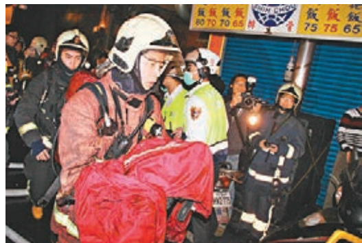
消防員以外套包裹1歲女童並緊急送醫，但仍不治。

香港文匯報訊 據中央社報道，新北市一處民宅三樓昨日凌晨發生火災，造成包括兩名兒童在內4人死亡，1人受傷。火場的民宅公寓鄰近夜市，消防局派遣多個分隊及各式消防車前往救援，但因現場巷弄狹窄，停滿機車，出入困難，一度難以搶救。有鄰居指出：「巷子小條，機車又多，消防車沒辦法進來，這樣做動作慢，就比較延誤啦。」但消防人員否認因此延誤救援速度。