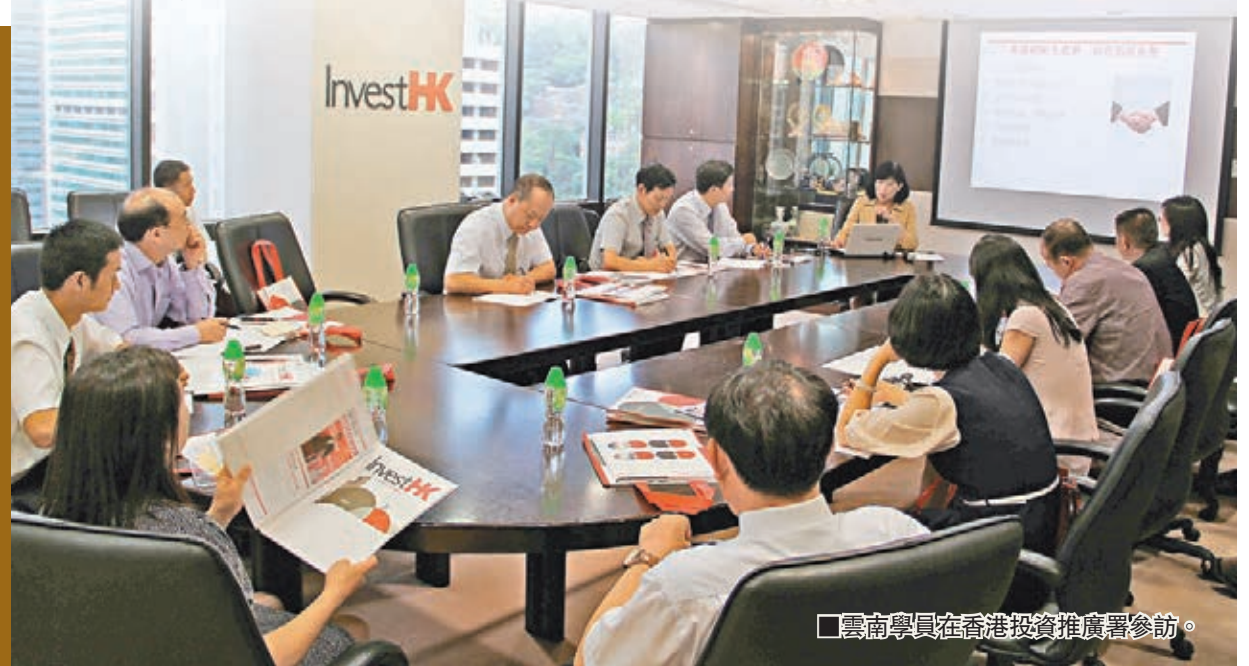
雲南學員在香港投資推廣署參訪。