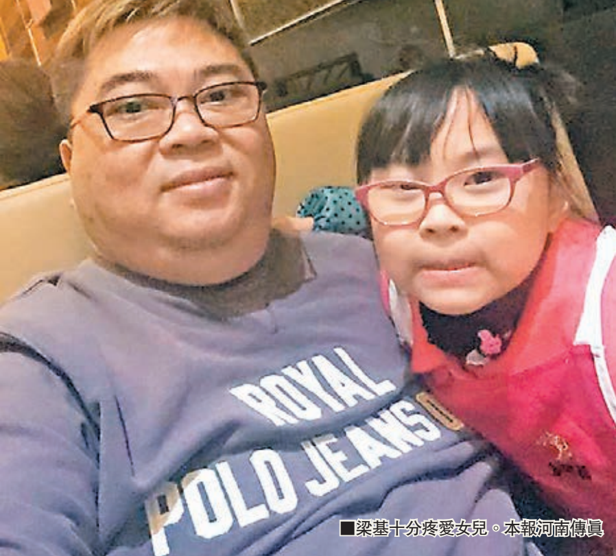
梁基十分疼愛女兒。