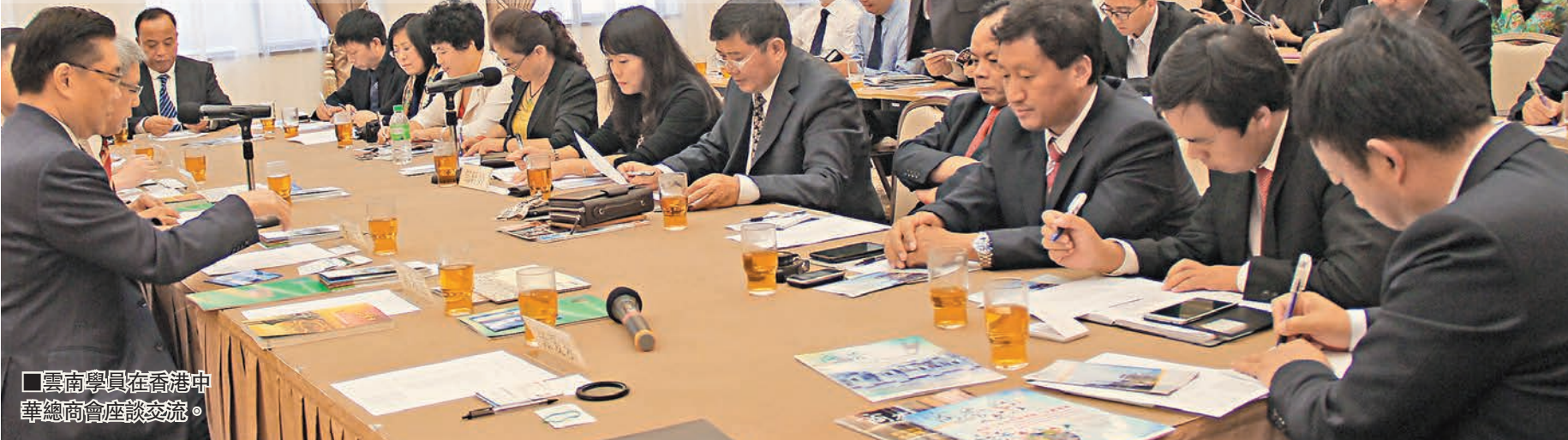
雲南學員在香港中華總商會座談交流。

由雲南省人力資源和社會保障廳、雲南省港澳事務辦公室主辦，香港文匯管理學院、香港《文匯報》雲南分社承辦的滇港省院省校合作人才高級研修班的成功舉辦，標誌着滇港合作從以往的經貿合作、高層互訪領域向人才交流等新領域拓展，邁入多層次、全方位的階段，人才交流正成為促進滇港合作的重要橋樑。