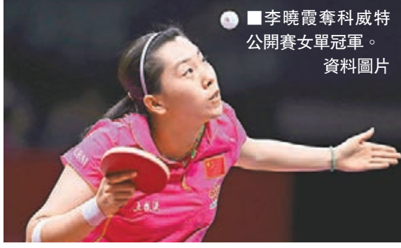
■李曉霞奪科威特公開賽女單冠軍。資料圖片

據搜狐體育消息,第三位獲得今年蘇州世界乒乓球錦標賽女單比賽資格的球員已經確定,她就是較早前在國際乒聯職業巡迴賽科威特公開賽上獲得單打冠軍的全滿貫球手李曉霞。 此前通過兩階段的「直通蘇州」選拔賽,劉詩雯和木子相繼脫穎而出,獲得世乒賽單打參賽資格。今次科威特公開賽,狀態回勇的李曉霞在準決賽和決賽中以4:1相同的比分力克隊友劉詩雯、丁寧,在贏得自己一年半來首個單打冠軍的同時也將世乒賽入場券收入囊中。 2013年巴黎世乒賽前,中國女乒規定在職業巡迴賽科威特和卡塔爾兩站中包攬冠軍的球員才獲得一張女單入場券。但今次卡塔爾公開賽與中國新春佳節接近,中國乒隊沒有派員參賽,科威特公開賽便成了考量隊員的唯一舞台。最終李曉霞脫穎而出,丁寧、朱雨玲、陳夢和武揚四大主力不得不為爭奪剩下的三張入場券而傷腦筋了。 據悉,中國乒隊已於年初四重新集結。稍後將兵分兩路,開始新一輪的封閉訓練。而蘇州世乒賽將於4月26日至5月3日間在江蘇省蘇州舉行。 ■記者 陳曉莉