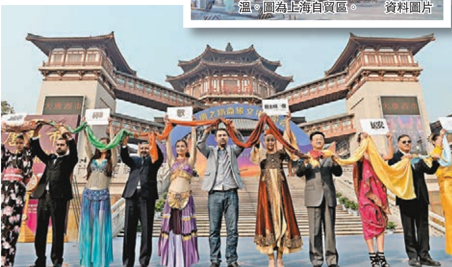
中國各地搶先佈局「一帶一路」尋覓經濟發展新動力。圖為西安舉行絲綢之路商旅文化博覽會。

今年31個省市區中，除上海不再設GDP增速目標，西藏保持不變外，其餘29個省市區均下調經濟增長目標。這一方面是「新常態」下淡化「以GDP論英雄」的信號，另一方面也是各地在中國經