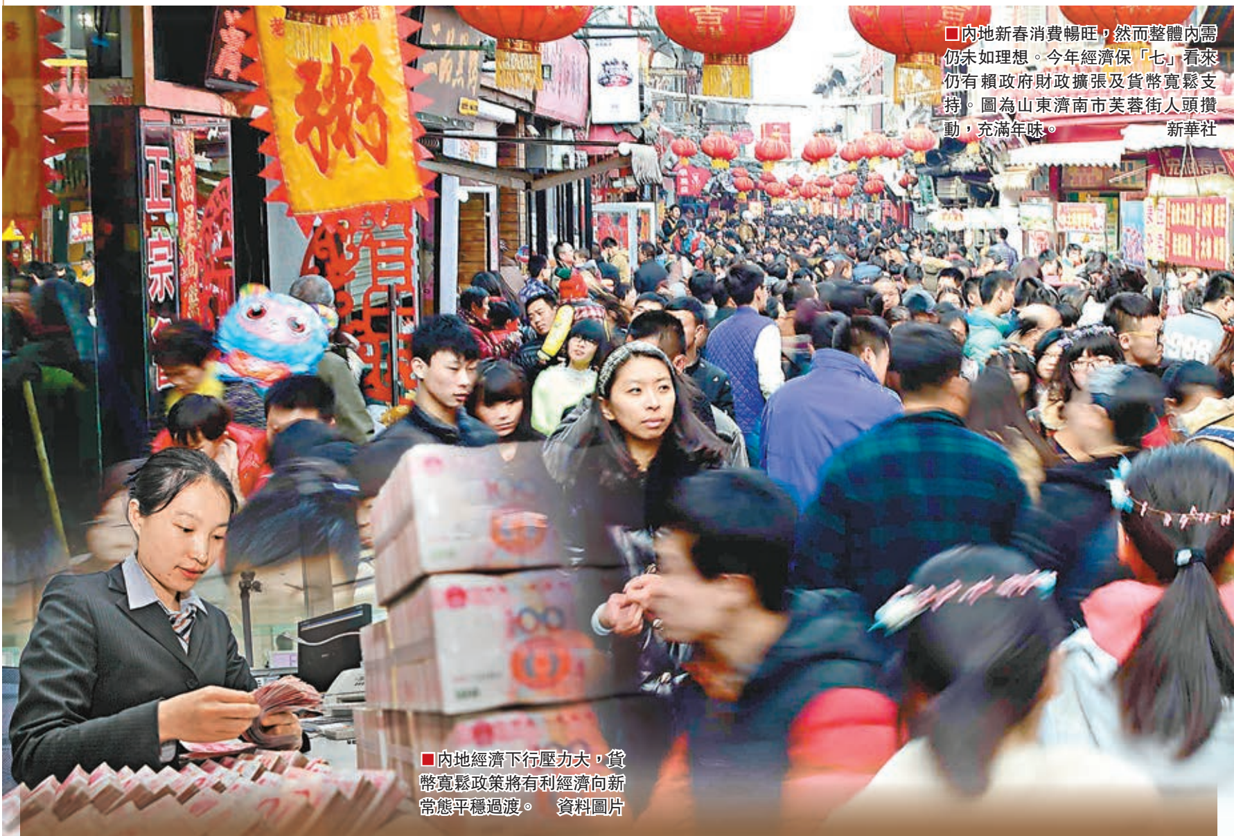
內地新春消費暢旺，然而整體內需仍未如理想。今年經濟保「七」，看來仍有賴政府財政擴張及貨幣寬鬆支持。圖為山東濟南市芙蓉街人頭攢動，充滿年味。新華社