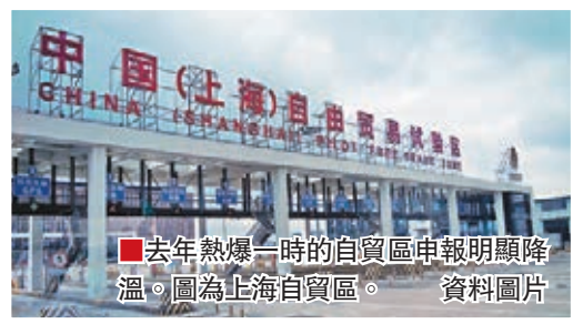
去年熱爆一時的自貿區申報明顯降溫。圖為上海自貿區。

在上海、天津、福建等獲准設立自由貿易試驗區的省市，自貿區建設都是政府工作重點。但整體來看，相較去年超過20省份表態要申報自貿區，今年僅陝西、甘肅、河南、湖北、遼寧、山東、廣西、吉林等8個省份把申報自貿區寫入政府工作報告，自貿區申報明顯降溫。