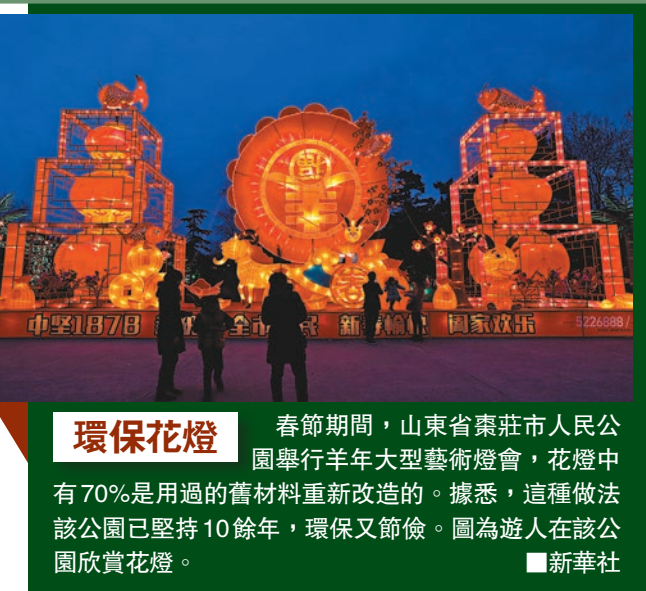
■春節期間，山東省棗莊市人民公園舉行羊年大型藝術燈會，燈中有70%是用過的舊材料重新改造的。據悉，這種做法該公園已堅持10餘年，環保又節儉。圖為遊人在該公園欣賞花燈。

據了解，祖祠建築以木石為主體，泥灰為佐料，集古建築之木雕、石刻、泥塑於一體。祠堂大門上方石匾上「羊氏祖祠」四字係原廣東省委書記吳南生所書。《廣州日報》