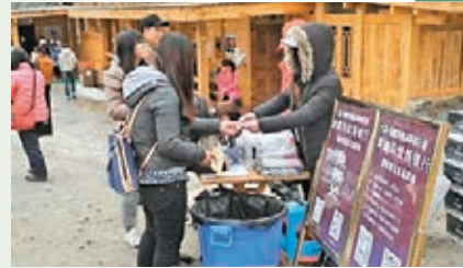
■遊客正在「垃圾銀行」兌換禮品。客主動撿起見到的垃圾。景區內現設兩個垃圾銀行，兩日來，共回收3萬餘名遊客產生的垃圾4萬餘袋，向遊客兌換海螺溝冰川這樣一來可以糾正遊客隨手亂扔垃圾的習慣，同時還能鼓勵遊客主動撿起見到的垃圾。景區內現設兩個垃圾銀行，兩日來，共回收3萬餘名遊客產生的垃圾4萬餘袋，向遊客兌換海螺溝冰川這樣一來可以糾正遊客隨手亂扔垃圾的習慣，同時還能鼓勵遊客主動撿起見到的垃圾。...

四川甘孜州海螺溝景區管理局消息稱，今年春節，海螺溝在加速推進創建5A之際，日前還成立了內地首個垃圾銀行。遊客通過「存垃圾」即可獲得景區精美小禮品。