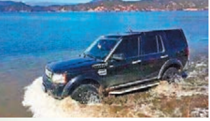
■汽車所經之處，可見湖水渾濁。

有遊客近日開車到雲南瀘沽湖「洗車衝浪」的照片出現在網絡中後，引發網民譴責。照片顯示，4輛越野車在湖泊的淺灘裡行駛並掀起水花，有的人還擺出造型拍照，車輛周圍的湖水亦泛起濁浪。