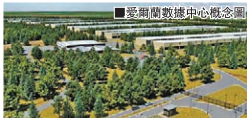
■愛爾蘭數據中心概念圖