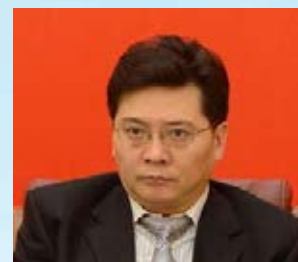
■廣東省委政研室主任張勁松。

廣東省委政研室主任張勁松指出，整個珠三角發展的短板在珠中江，而珠中江的關鍵節點就是交通、產業、環境、人口、海洋等問題，在這些節點中，最基礎的就是產業的問題。產業則涉及產業的集聚、創新驅動以及勞動成果如何分享等問題。