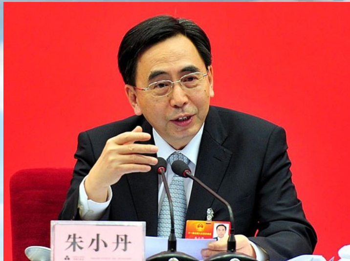
■廣東省長朱小丹在政府工作報告中提及珠江西岸建設和發展。