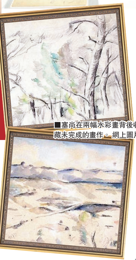
■塞尚在兩幅水彩畫背後收藏未完成的畫作。網上圖片

成，難以判斷內容，加上畫紙寫有「non」(不)，相信是塞尚判斷畫作未完成，不會出售；另一幅素描則是描繪民宅及埃圖瓦勒山脈風景，後者常是塞尚的作品主題。【《星期日郵報》/美聯社/路透社