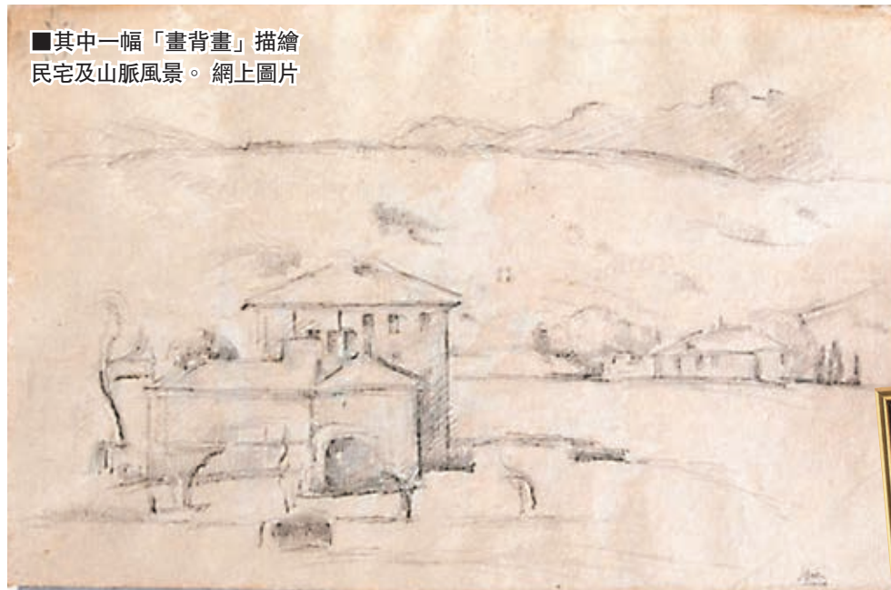
■其中一幅「畫背畫」描繪民宅及山脈風景。網上圖片