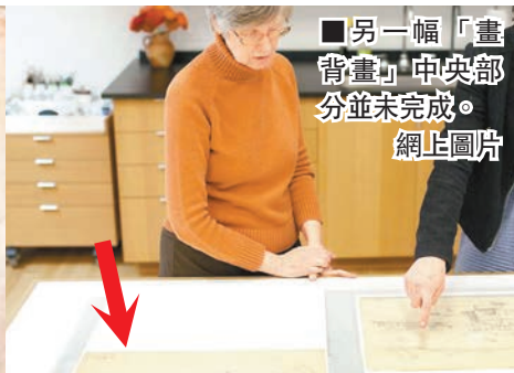
■另一幅「畫背畫」中央部分並未完成。