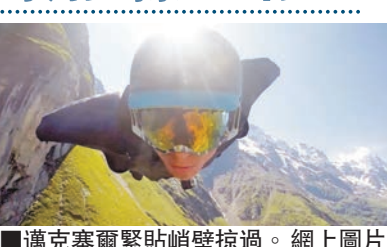
■邁克塞爾緊貼峭壁掠過。

美國滑翔專家邁克塞爾去年穿上特製飛鼠裝，從瑞士的阿爾卑斯山一躍而下，穿越森林、掠過峭壁，全程用GoPro攝影機拍下。影片去年8月上載至影片分享網站YouTube，至今已吸引逾16萬網民觀看。