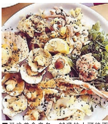
■沿途美食眾多，試過的人可能不多。

兩人在過去200日已遊歷16個國家，他們在旅程中不僅介紹景點，更希望將到過的地方、遇見的人連在一起。二人下月將前往新西蘭及太平洋島嶼新喀里多尼亞，並計劃在亞洲逗留一年遊覽香港等地，之後再轉戰非洲。