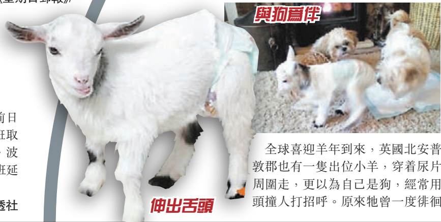
全球喜迎羊年到來，英國北安普敦郡也有一隻出位小羊，穿着尿片周圍走，更以為自己是狗，經常用頭撞人打招呼。原來牠曾一度徘徊