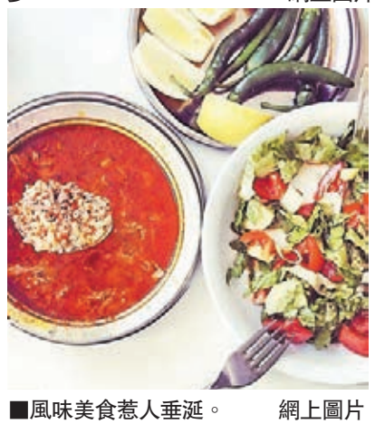
■風味美食惹人垂涎。網上圖片