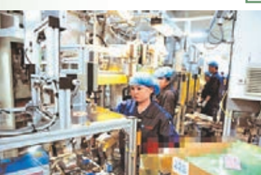
■博世汽車部件長沙有限公司車間內，工人們正在忙碌。

春節是團圓的日子，然而很多人仍需堅守工作崗位。在湖南長沙，博世汽車部件長沙有限公司車間內，雖是過年，工人們仍然忙得熱火朝天。有工人表示，春節期間加班，可拿6倍工資。