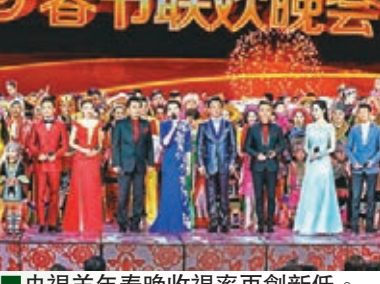
■央視羊年春晚收視率再創新低。

2015年央視羊年春晚近日公佈收視率。數據顯示，除夕當晚，央視春晚電視直播收視率為28.37%，創下8年新低，觀眾規模也是首次跌破7億。