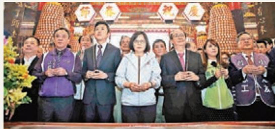
■蔡英文在新竹市城隍廟焚香祭拜，祈求平安。