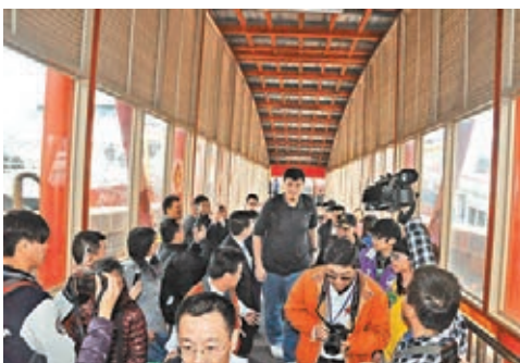
■姚明被同船旅客競相手持相機或手機搶拍。