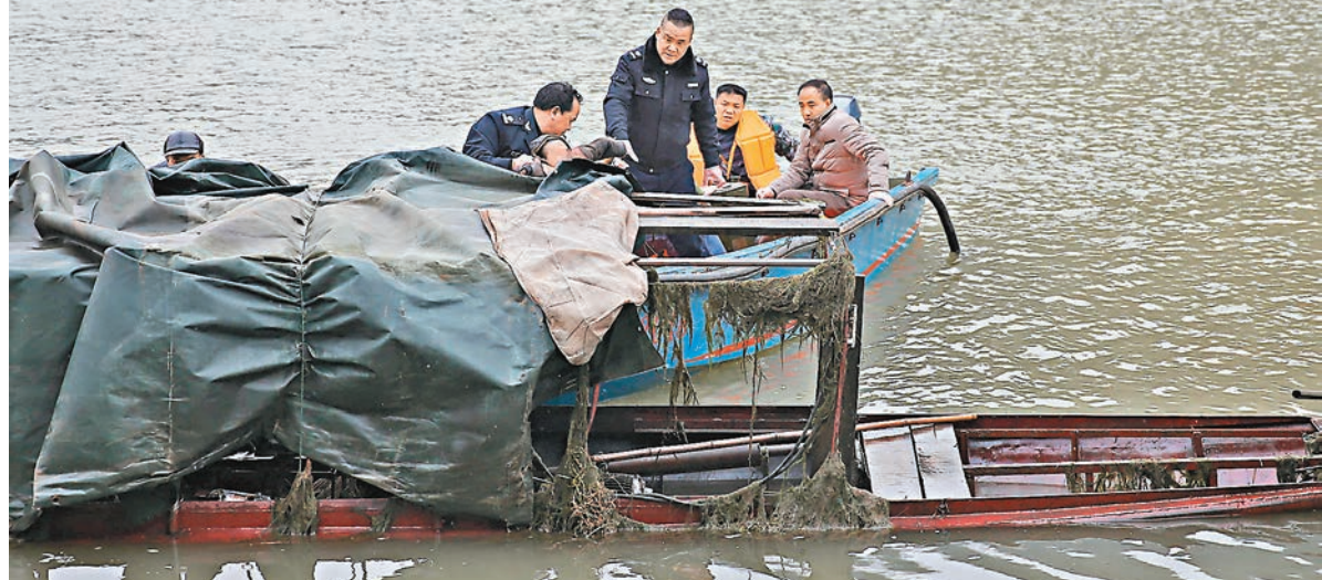
■搜救人員在失事船內打撈出一名孩子的遺體。