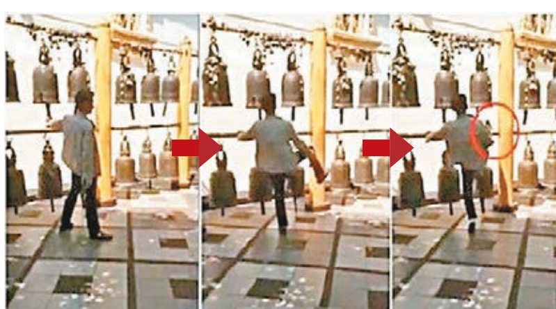
■中國遊客踢古鐘的過程被全程拍下。