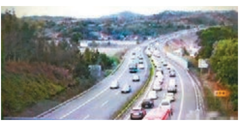
河源交警在官方微博公布的交通實時圖。 本報廣州傳真

香港文匯報訊（記者 張紫、晨帥誠 綜合報道）昨日是大年初五，春節假期第六天，從前天開始，內地高速公路出行迎來返程小高峰。針對各地群眾節後陸續返城、車流增大、交通衝突多等特點，各地交管部門將合理配置警力，加強疏導分流，減少返城道路擁堵情況。