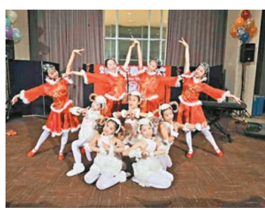
中國天津華夏未來少兒藝術團在聯合國大會多功能廳專場演出。 本報天津傳真

香港文匯報訊（記者 達明、通訊員 趙爽 聯合國報道）美國當地時間農曆大年初二（北京時間2月21日），聯合國總部大廈，聯合國中文處、中國書會的工作人員及家屬歡聚一堂，中國天津華夏未來少兒藝術團在此舉行歡度中國年專場演出。