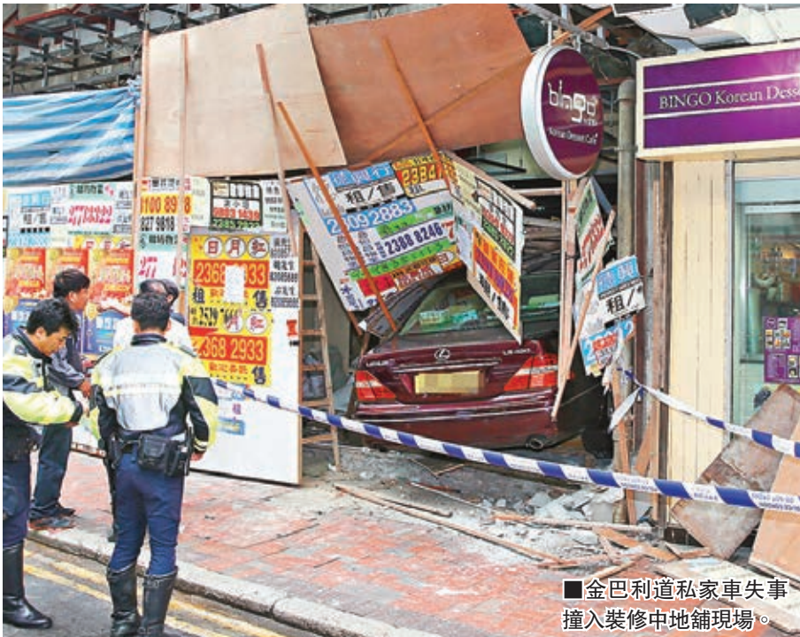
金巴利道私家車失事撞入裝修中地舖現場。

方接報到場將其送院治理。肇事房車姓周司機事後在場協助警方調查，有人承認不慎誤將油門當腳掣出事，他並通過酒精測試。