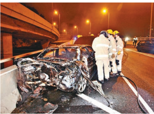
日產Skyline撞毀後着火焚毀，消防事後調查原因。

現場消息稱，現場附近鯉魚門邨有居民表示，在跑車失事撞壁期間，目睹有多輛私家車高速駛離現場，疑涉非法賽車。警方在現場發現失事跑車遺下長達50米煞車胎痕，初步懷疑有人高速轉右彎失事，正調查意外是否涉及非法賽車。