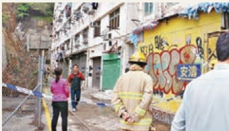
牛頭角啟德大廈被人在走廊縱火燒雜物，消防將火救熄後展開調查。

香港文匯報訊（記者 杜法祖）牛頭角啟德大廈昨晨有走廊雜物着火，70多名住客自行疏散到天台及地面躲避，其中一名住客被濃煙所困，為保命爬出窗口游繩逃生，幸僅雙手割傷。消防將火救熄後認為起火原因有可疑，交由警方暫列「縱火」案調查。