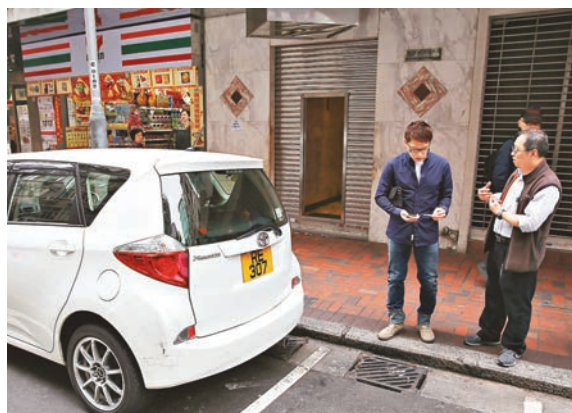
周先生(右)向無辜被撞花左車尾司機致歉。