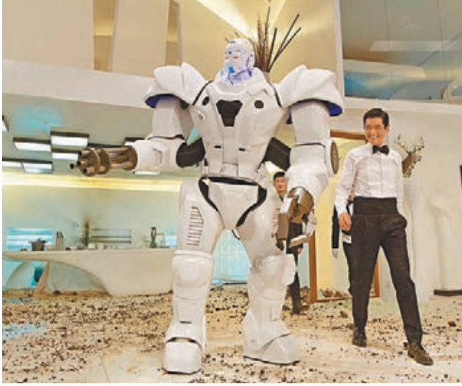
發哥稱很喜歡與這名「管家」對戲。

香港文匯報訊 由王晶執導、劉偉強監製、鑽石級華麗陣容周潤發、張家輝、劉嘉玲、余文樂、王詩齡聯合主演之《賭城風雲II》於今日舉行優先場。今次電影可謂娛樂性十足，除了大晒觀人觀景之外，又有上天下海火爆動作，原來發哥「收埋」秘密武器，這個武器就是戲中發哥的機械人管家，它名為「復強」，這名機械人遇上強敵時化身變形金剛，還會跳舞助興，除了機械人的模型外，動作場面全是後期特技，是在港產片少有的場面。而這名機械人更搞笑地講潮州話，一句「飲茶定咖啡」令現場觀眾笑噴噴，張家輝更與這名機械人時常互相捉弄，更會扮成初級版「復強」，兩者成為一對歡喜冤家。發哥稱很喜歡與這名管家對戲，讓他可以自由發揮港式「潮州」口音。