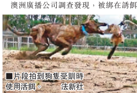
■片段拍到狗隻受訓時使用活餌。

澳洲賽狗業的規模在全球數一數二，從業員達3萬，不過業界近日被揭違法使用兔、小豬、負鼠等小動物作為訓練賽狗的誘餌，任由小動物活生生被撕成碎片，部分更會被「循環再用」，直至死掉。事件曝光後引起公憤，多省賽狗會及政府均已展開調查。 澳洲廣播公司調查發現，被綁在誘餌