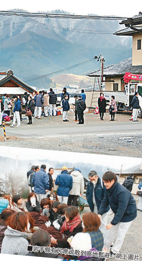
■岩手縣有民眾疏散到高地暫避。