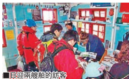
■目迎兩艘船的訪客