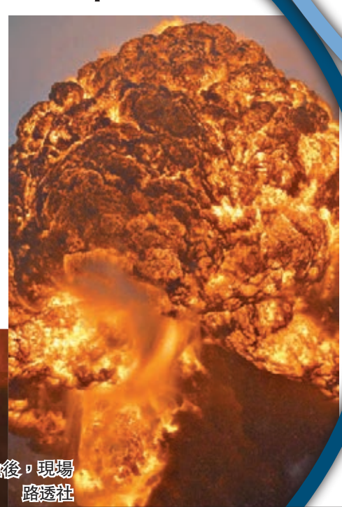
■爆炸發生後，現場火光熊熊。

美國一列搭載100多個原油槽的貨運列車，前日在大風雪中行經西弗吉尼亞州南部時出軌。至少一個油槽墜落旁邊河道，另有最少14個油槽起火，火球冲天至少90米高，現場附近的兩個縣進入緊急狀態。 肇事火車所屬的CSX運輸公司稱，火車當時正由北達科他州運載109個原油槽至弗吉尼亞州沿海約克鎮。事件中有一人可能因吸入濃煙不適，正接受治療。火車在事後數小時仍持續冒起烈焰。 消防部門預計善後工作需時數天，附近約200名居民被迫撤離。有住在800米高山上腰上的居民表示，感覺到火焰的熱度，形容「有點恐怖，像原子彈爆炸。」