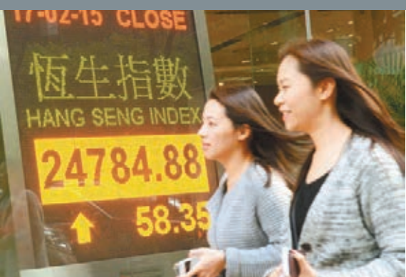
■港股昨升58點，馬年「收爐」前夕，買賣兩開，大市成交僅469億元。

香港文匯報訊（記者 周紹基）港股昨日是馬年「收爐」前最後一個全天的交易日，雖然今日「大除夕」還有半日市，但投資者已提早休戰，大市昨成交僅469億元，買賣兩開，是8個月以來的最低水平。恒指未受希臘債務問題談判破裂所影響，收報24,785點，升58