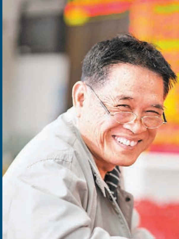
■A股七連漲，馬年完美收官，股民笑逐顏開。