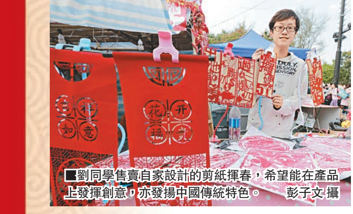
劉同學售賣自家設計的剪紙揮春，希望能在產品上發揮創意，亦發揚中國傳統特色。

年宵市場是不少市民度歲的「指定動作」。在全港最大的維多利亞公園年宵市場，昨日即使日間時分，場內都逼得人頭湧湧，年花、氫氣球以及各式各樣的「羊貨」各有捧場客。 劉同學與朋友參加九龍社團聯會青年事務委員會的「懶羊羊」攤位，售賣自家設計的剪紙揮春，祝賀語句也不乏「潮語」，包括「出池有望（即成功拍拖）」、「DSE擇硬5**」、「（大專分數）過三爆四」等，深受年輕人歡迎。 劉同學表示，希望在傳統的新春佳節，除在產品上發揮創意，亦希望同時發揚中國傳統特色。他說，自己也正在修讀商科文憑課程，可藉今年年宵學以致用，現時生意亦接近收支平衡，今日亦會加強推銷，以吸引更多市民購買。 首次參加年宵市場售賣的凌小姐，與志願機構合作，由一班肢體傷殘人士、唐氏綜合症患者等，用羊毛布和黃豆袋製作「去濕暖羊羊」公仔，除可將公仔放在頸背以收「去濕」之效外，將黃豆包加熱可當作暖包之用。她表示，現時公仔售價已低於市價，以收宣傳之效。她除了售賣公仔，亦附送不同公仔圖樣的印章，以吸引更多市民購買。