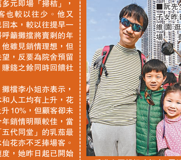
阮先生與一對子女昨日一同到維園遊年宵市場。

一對8歲和4歲的女兒一同到維園遊年宵市場，與子女一同感受節日氣氛。他在場內買了榨汁機、年花和表情公仔咕啞，花費約400元。他說，到維園已成多年在港過節的習慣，「消費也沒甚麼預算，都是見到甚麼有趣就去買。」 周太和女兒專程從大嶼山坐船搭車到銅鑼灣維園遊年宵。周太說，維園年宵市場比其他地區的大，氣氛也特別濃厚，所以特意到來走走。今年的天氣較往年好，場內的貨品也非常有創意和有趣。她和女兒在場內花約500多元，買了多個大型文具公仔。她笑言，雖然所買的都是「無謂嘢」，但新年但求開心，多消費點也「無所謂」。 每年都會到維園年宵的張先生，昨日也與太太一同買年花，以228元買了一束劍蘭和銀柳。張生笑言，特色公仔等都只是年輕人的玩意，年長一輩的還是鍾情年宵買年花的感覺，期望新的一年大家都身體健康，像銀柳「有銀又有樓」。