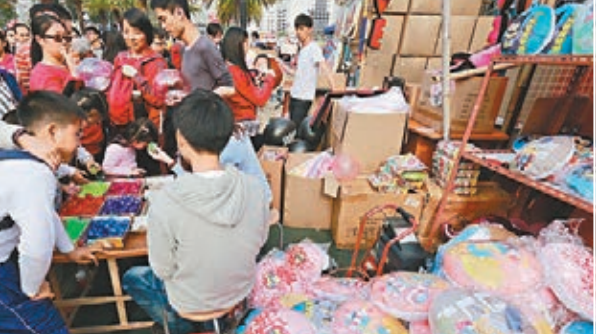
攤檔出售的「真普選」主題的咕啞嚴重滯銷，要臨時改賣「小飛人」水球，終大受小朋友歡迎。