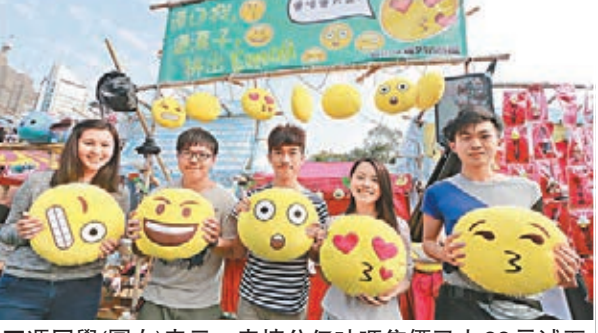
馮同學（圖右）表示，表情公仔咕啞售價已由88元減至50元，若今晚仍未賣清，會再割價。